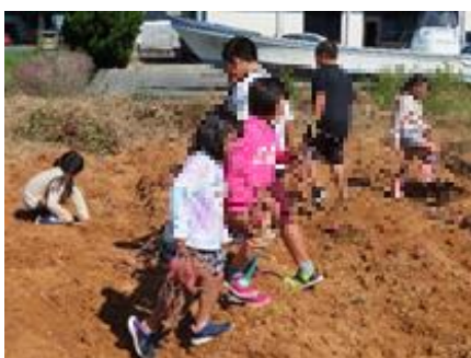
たーくさんとれたよ