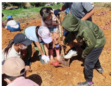
うわー 大きいおいもだー