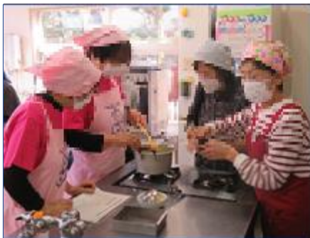
食改さんの指導で、テキパキと