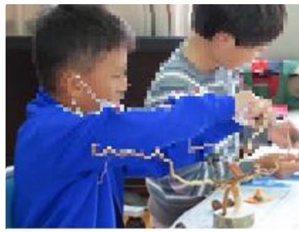
枝の上に乗せるの難しいよー