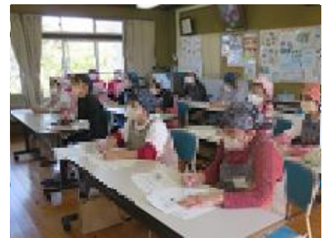
糖尿病についての講話です

今回は、「リンゴとサツマイモの羊羹」です。参加者からは、お正月用に使いそう、色がきれい、楽しくできた、初めは難しそうだったけどよくできて良かった等の感想が聞かれました。第5回目は、「生八つ橋づくり」です。