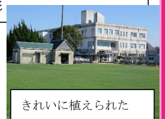
きれいに植えられた 走潟小運動場の冬芝生