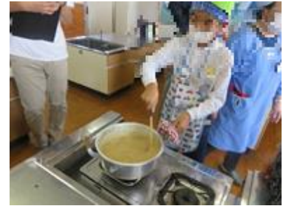
しっかりまぜておいしくな一れ