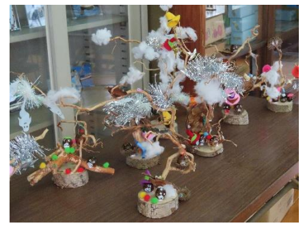
作品ができあがりしました