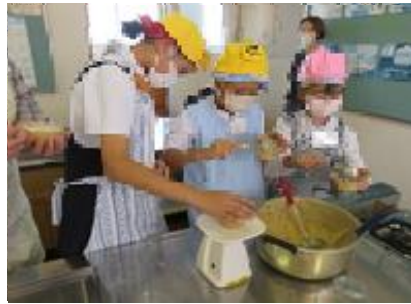
おいしそう、そっと入れよう