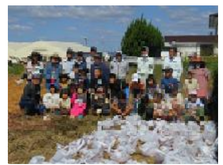
手伝ってくださった皆さんと 記念撮影