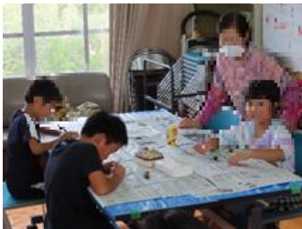
さあ、どんな形にしようかな