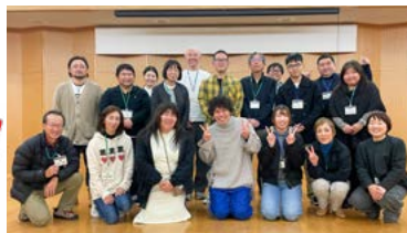
【クリエイター塾懇親会】