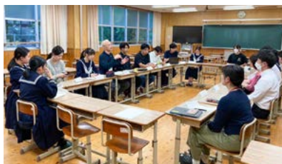
【宇土高校で開催した「うとっこ」】

印象的だったのは、宇土高校の生徒たちが考案した海苔のパウンドケーキが、地域の方々との連携により商業ベースでの生産が実現したことです。