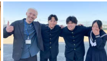
【ハロウィンフェス実行委員】

令和5年10月からの1年3ヵ月、DMM.com Baseという石川県の会社から、地域活性化起業人として毎月宇土を訪れ、宇土市の皆さんと一緒に仕事をさせていただきました。