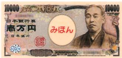
いちまん えん 10000円