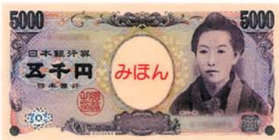
ごせん えん 5000円