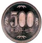
ごひゃく えん 500円