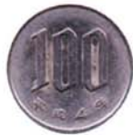
ひゃく えん 100円