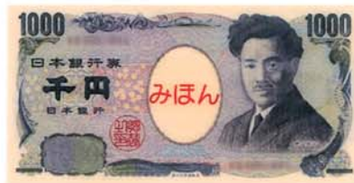
せん えん 1000円