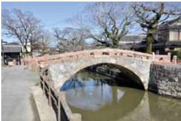
災害復旧工事が完了した船場橋