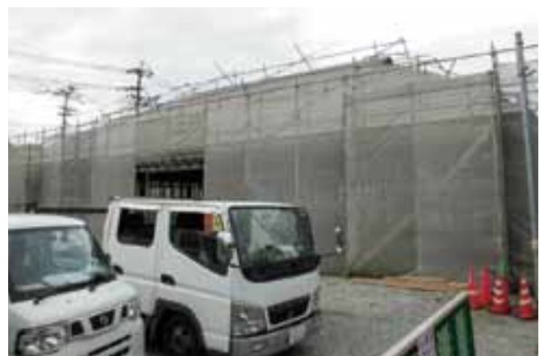
再建に向け工事中の中央公民館