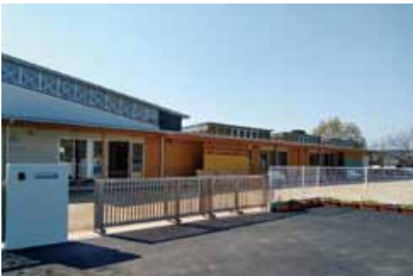
建替えが完了した花園幼稚園園舎

平成30年8月に資材費1/2助成の上限額を5万円から10万円に引き上げた結果、本補助金の活用件数が16件(H30)から24件(R1)に増加しました。