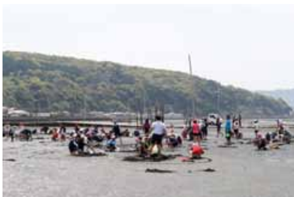
潮干狩りを楽しむ参加者たち(長浜地区)

関係機関と学校と合同で緊急点検を実施し、担当者会議を開催して対策等の検討を行いました。点検の結果、国道の歩道への転落防止柵設置や交通規制等を関係機関に実施していただきました。