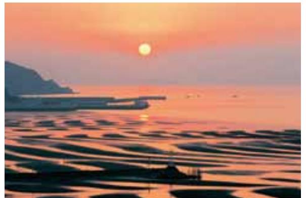
県名勝に指定された「宇土半島の御輿来海岸及びその周辺の砂紋」

令和元年度は、建て替えに係る生活環境影響調査を終了し、関係市町の住民に調査報告書の縦覧をしました。