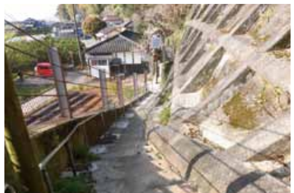
整備した津波避難路と照明(網田新地区)