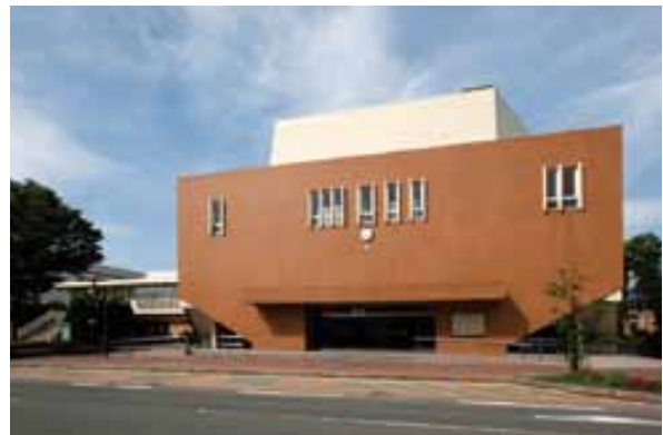
ネーミングライツの導入を目指す市民会館