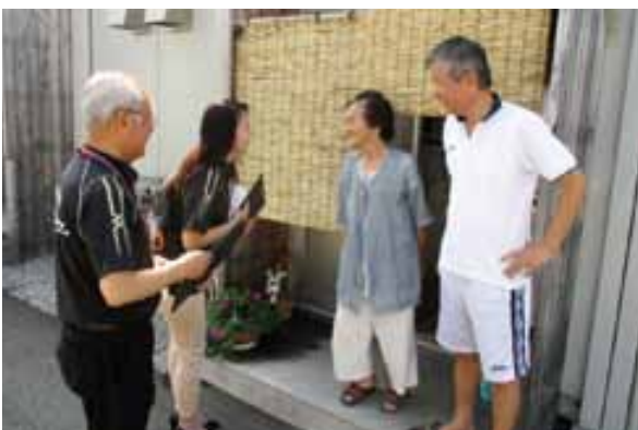
地域支え合いセンター訪問時の様子

旧高月邸の災害復旧工事が平成30年8月に完了し、平成31年4月から一般公開を開始しました。