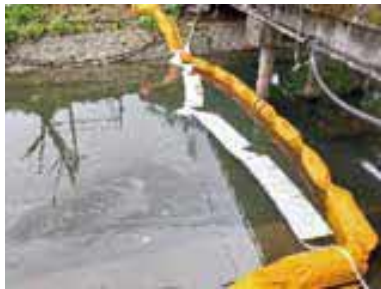
※油流出事故の処理費用は原因者の負担になります。

油流出事故は、給油時の不注意やタンクの劣化、配管不良などが原因で発生します。家庭や農地(ビニールハウス)に油類のタンクがある人は定期的に管理・点検を行い、細心の注意をお願いします。不要な油は貯めずに、処理業者などに処理を依頼しましょう。万が一事故が発生した場合は、すぐに市役所や消防署等に連絡してください。