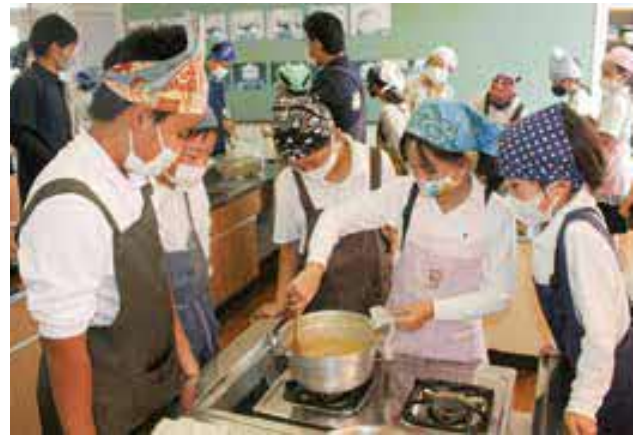
こま切れにしたマルメロを煮詰める児童たち

10月29日(金)、走潟小学校で4年生20人が「マルメロ」のジャムを作りました。マルメロは中央アジア原産の果物で、果実は洋梨に似た形をしています。かつて走潟地域で栽培されていましたが戦後に途絶え、近年において「走潟マルメロ会」が果実を育て復活を図り、地域活性化のシンボルにしようと取り組んでいます。児童たちは、マルメロ会員の熱心な指導を受け、果実をこま切れにして煮詰めてグラニュー糖を加えた後、さらに煮詰めてジャムを完成させました。児童たちは、作ったジャムをクラッカーにのせておいしそうに食べていました。