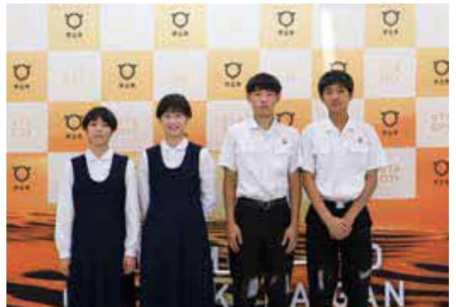
女子ハンドボール部、男子ハンドボール部の皆さん