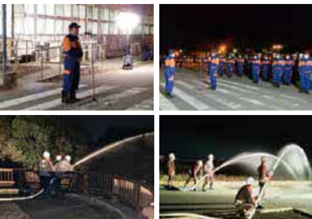
火災予防を呼びかけました