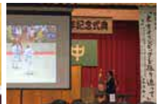
創立100周年を祝った宇土高校