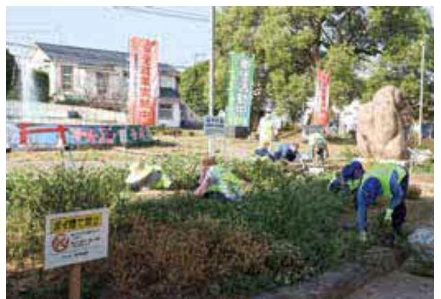
草取りをするシルバー人材センターの会員の皆さん

10月16日(土)、公益社団法人宇土市シルバー人材センターが、中央公園で社会奉仕活動を行いました。この活動は、10月の「シルバー人材センター事業普及月間」の第3土曜日を「シルバーの日」として毎年奉仕活動を行っているものです。奉仕活動には会員約30人が参加し、宇土市シルバー人材センターと表記された安全ベストを着用して約1時間の草取りやごみ拾いなどの清掃活動を行い、2トントラックいっぱいの雑草や木の枝、ごみなどを回収しました。