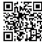
「低所得の子育て世帯に対する子育て世帯生活支援特別給付金」ページ

令和3年4月分の児童手当が支給された人は、8月5日に振込済です。 給付額 児童1人当たり5万円 申請期限 2月28日(月)