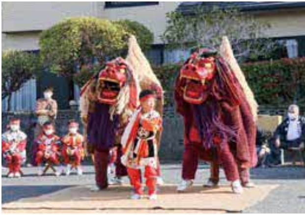
本町1丁目で奉納された「宇土御獅子舞」