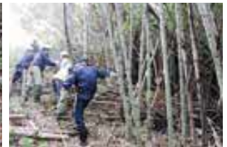
地縁団体「上松山区」のみなさん