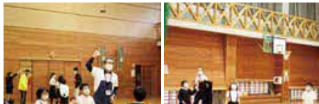
みんなでドローンについて楽しく学びました