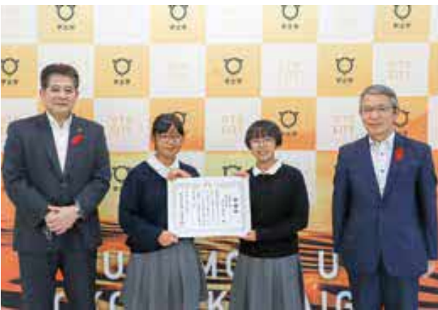
毎年6年生を対象に養成講座を実施しています

10月19日(火)、西岡神宮秋季大祭が開催されました。今年は新型コロナウイルス感染症拡大防止のため、本町1丁目と西岡神宮拝殿前の2カ所において、県指定重要無形民俗文化財の「宇土御獅子舞」が奉納されました。宇土御獅子舞は、1740年に五穀豊穡と子孫繁栄などを願って奉納したのが始まりとされ、現在は本町1丁目の住民を中心とした保存会により継承されています。銅鑼や太鼓の音に合わせた玉振りの子どもと雌雄2頭の獅子の迫力ある舞に、訪れた人たちから大きな拍手が送られました。