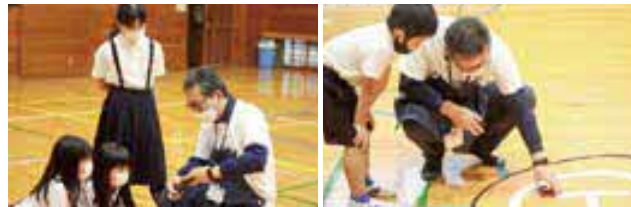
初めて見るドローンに興味津々の児童たち

地域おこし協力隊は、プログラミング教室、ドローン教室、eスポーツ教室を今後も企画・開催します。個別開催のご相談にも応じますのでお気軽にお問い合わせください。