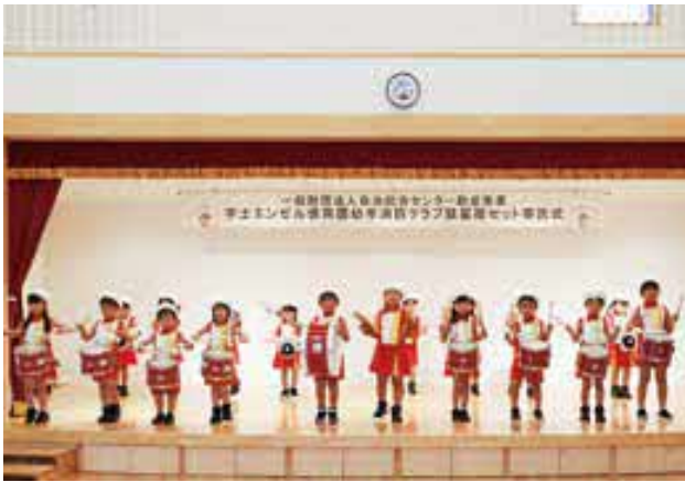
鼓笛隊セットを使って演奏する園児たち