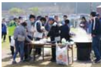
駅伝大会のようす