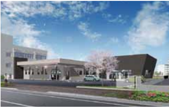
老人福祉センターイメージ