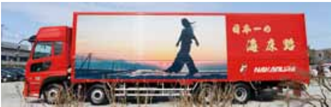
(写真上) 御輿来海岸 (写真下) 長部田海床路