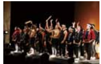
宇土太鼓祭のようす