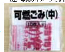
平織式 (1枚ずつ取り出すタイプ)