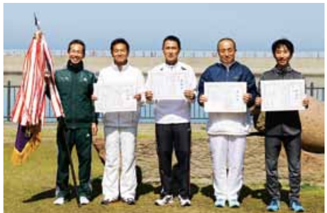
紳士駅伝優勝の宇土地区体育会Aチームのみなさん