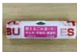
ロール式 (1枚ずつ切り離すタイプ)