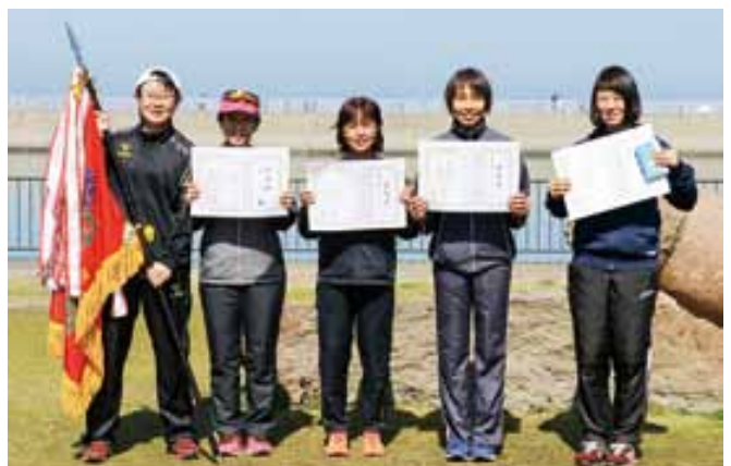
女子駅伝優勝の宇土地区体育会のみなさん