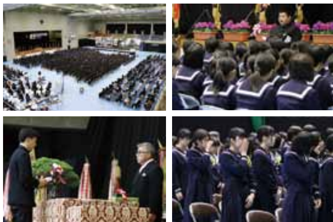
市民体育館で行われた鶴城中学校卒業式

卒業生内訳 鶴城中259人、住吉中41人、網田中19人、宇土小128人、花園小100人、緑川小18人、走潟小19人、網津小36人、網田小17人、宇土東小61人