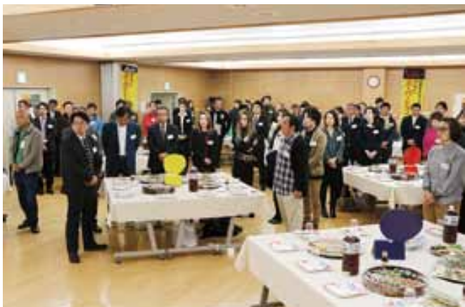
大懇親会参加者のみなさん