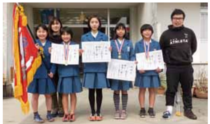
花園小学校A exciteのみなさん