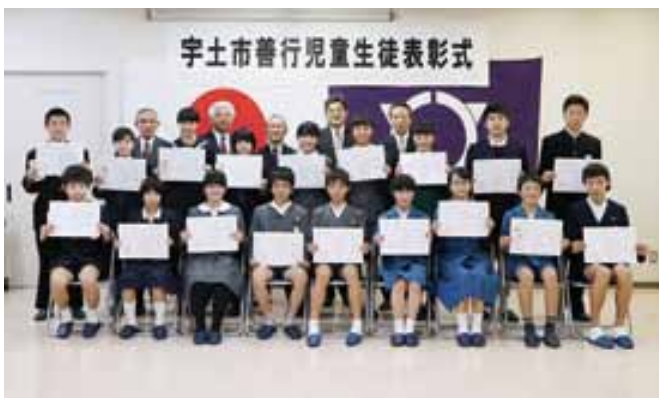
善行表彰受賞者のみなさん