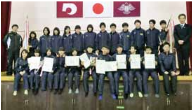
宇土高校陸上部のみなさん