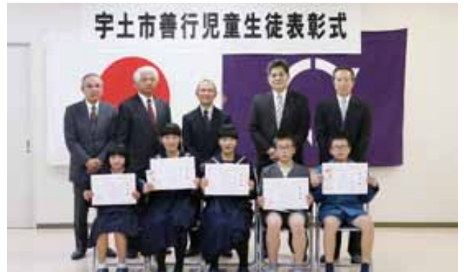
温定賞受賞者のみなさん