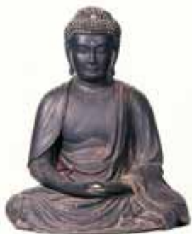
右:木造釈迦如来坐像(熊本県指定重要文化財) 左:木造寒巖義尹坐像(宇土市指定有形文化財) いずれも如来寺蔵