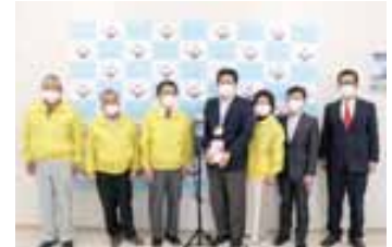
宇土ロータリークラブ 株式会社ダイワ電化センター カネミツソリューションズ合同会社