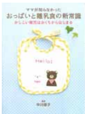
ママが知らなかったおっぱいと離乳食の新常識 / 中川信子監修 / 小学館

ただ、明瞭な構音が難しいお子さんの全てが、食事が原因ということではありません。中には、「その歯並びで、よくぞきれいな音を作るもんだ！」と、感心するお子さんいらっしゃいます。正しい構音の獲得には様々な要因があり、その要因の一つとして「発達の違い」もあります。ことばの不明瞭なことばの遅れは、氷山の一角に過ぎないことがありますので、年齢に見合ったことばが聞かれないときは、市の保健センターや療育機関にご相談されると良いかと思えます。