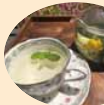
お湯を注いで有効成分を抽出し、ハーブティーとして。