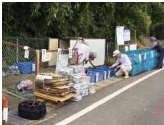
「資源ごみの日」の分別状況