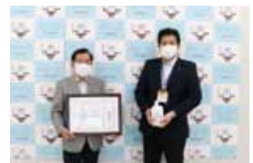
株式会社福永薬局