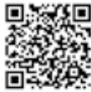
熊本eスポーツクラブ ホームページ

☎ 熊本eスポーツクラブ ☎050(5375)4028 Facebook「熊本eスポーツクラブ」