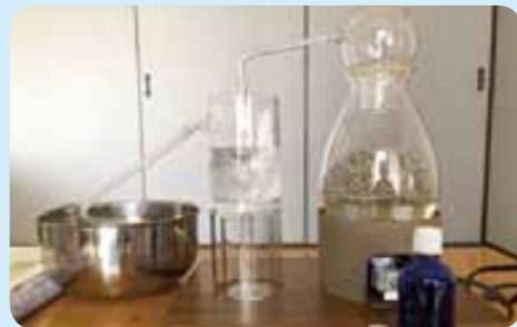
器具を使い、天然の香り成分を抽出してルームスプレーなどを作ることができます。