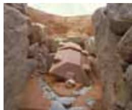
右：今城塚古墳、左上：今城塚古墳出土馬門石石棺（蓋の破片）、左下：植山古墳出土馬門石石棺