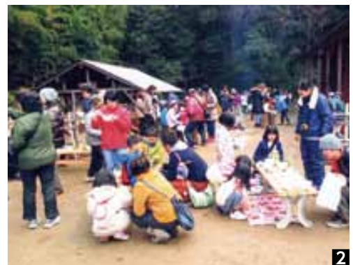
①_ 毎年12月に開催するオリエンテーリング。多くの人参加する。 ②_ オリエンテーリングでは、みんなで昼食を食べて交流を深める。