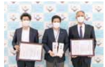
株式会社カネムラエコワークス 三菱ケミカル株式会社 熊本工場