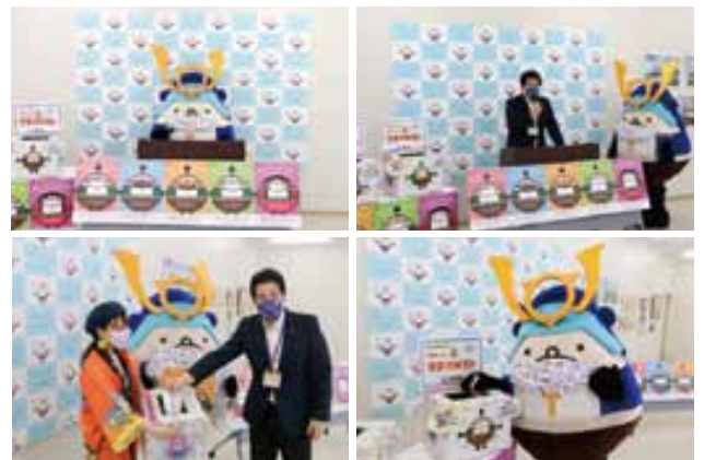
マスク着用を呼びかけます

6月2日(火)、『みんなでマスク』プロジェクト記者発表会が市役所仮設庁舎で行われました。『みんなでマスク』プロジェクトは、新型コロナウイルス感染症対策としてマスク着用の啓発を行い、感染拡大防止に取り組むことを目的としたものです。プロジェクトは、「うとん行長ちゃん」とコラボしたマスク着用の啓発ポスターやチラシ、カードを掲示した周知・啓発活動を実施するほか、マスクを必要とする人や施設、団体にマスクを届けるため、市内8カ所に善意のマスクポストを設置し、提供可能なマスクを回収する活動を行います。