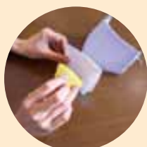
ペーパータオルに香りをつけてマスクに挟む。