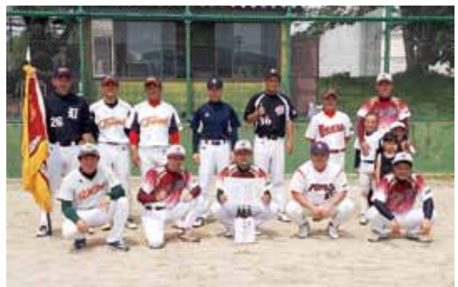
轟地区が優勝に輝きました