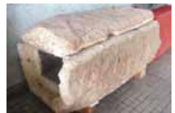
(写真2) 馬門石製の石管

馬門石製の石管(写真2)を連結し、蓋を付けて開閉式にすることで石管内部の清掃や破損した石管の取替が簡単にできる仕組みになっています。石管と石管、あるいは石管と蓋を接合する際に使われているものが「ガンゼキ」と呼ばれる自然素材の接着剤です。「ガンゼキ」は赤土、貝灰(貝殻の粉)、食塩、松汁を混ぜ合わせて作られ、混ぜ合わせてから数時間は柔らかい状態が続きますが、時間が経てば水の中でも固まるという性質があります。現在の「ガンゼキ」は江戸時代とは少し製法が異なっています