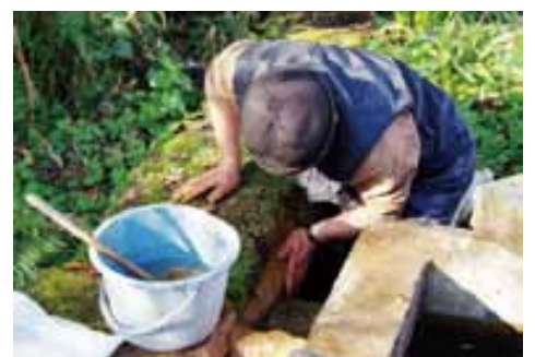
ガンゼキを使った補修

馬門石製の石管(写真2)を連結し、蓋を付けて開閉式にすることで石管内部の清掃や破損した石管の取替が簡単にできる仕組みになっています。石管と石管、あるいは石管と蓋を接合する際に使われているものが「ガンゼキ」と呼ばれる自然素材の接着剤です。「ガンゼキ」は赤土、貝灰(貝殻の粉)、食塩、松汁を混ぜ合わせて作られ、混ぜ合わせてから数時間は柔らかい状態が続きますが、時間が経てば水の中でも固まるという性質があります。現在の「ガンゼキ」は江戸時代とは少し製法が異なっています