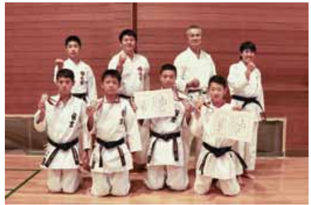
住吉中学校選手のみなさん