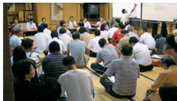
●市民が考える総合計画策定に向けて、「まちづくり座談会」開催