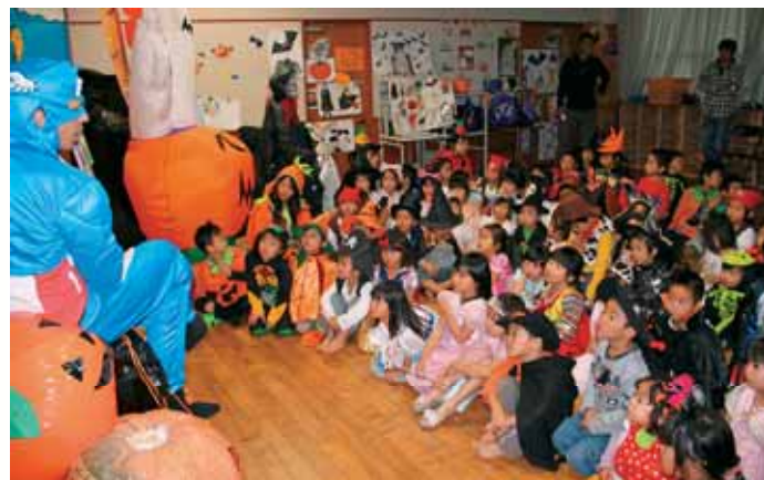
●国際理解を深め、グローバルな人材育成を目的とする「外国語教育」