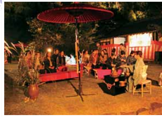
名月茶会 琴と尺八の優雅な調べを聴きながら、轟水源の水でたてたお茶を満喫