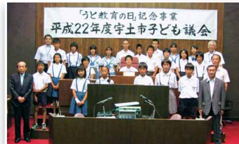
●「子ども議会」子どもの自由な発想や視点から捉えた質問や意見を発表

地方分権が進展していく中、市民と行政が良きパートナーとしてまちづくりに取り組んでいかなければなりません。このため、情報を共有し、協力をしながら、魅力あるまちづくりに取り組んでいます。