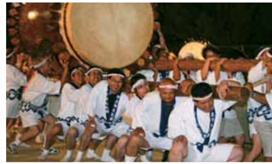
宇土大太鼓フェスティバル 毎年、8月第1土曜日開催