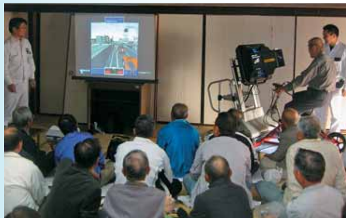
●各地区で行われた「交通防犯教室」

快適で潤いある生活環境を守るため、規制措置や環境啓発活動などにより、身近な生活環境の保全を進めています。また、地球規模の環境問題への対応に向けて、市民・事業者・行政が共に力を合わせ、地域での環境保全活動を積極的に実施していくとともに、分別収集の徹底や資源ごみの有効利用など、資源循環型社会の構築に努めています。