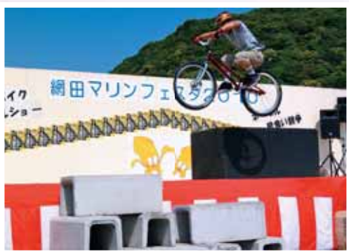
マリニフェスタ 宇土マリーナで開催