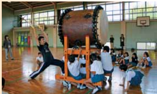
●太鼓とふれあうことで、豊かな心の育成と文化芸術への関心を高めることを目的にスタートした「太鼓アウトリーチ事業」