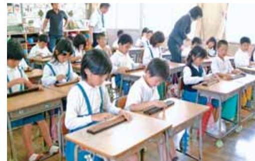
●小中学校で取り組むそろばんの時間