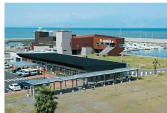
道の駅 宇土マリーナ 平成18年には宇土マリーナ物産館「おこしき館」もオープン