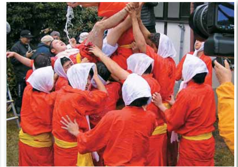
甘酒まつり 旧暦の11月申の日に山王神社で行われる。申に扮した若者たちが「ホーライホーライ」の掛け声とともに徳利を奪いあい、甘酒を掛けあいながら、無病息災を願う