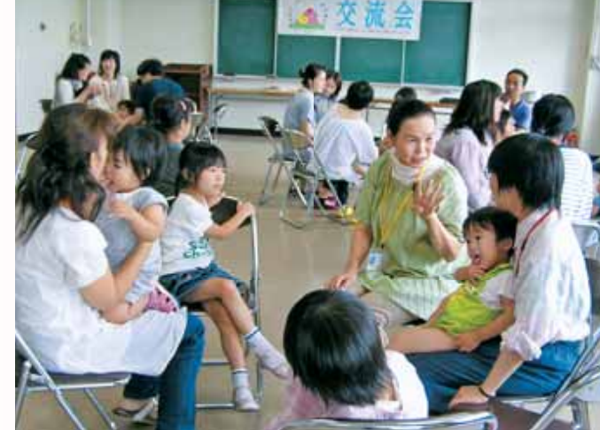
●第1回交流会の風景

安心して子どもを産み、育てることができるよう、そして21世紀を担う子どもたちが健やかに育つことができるよう、地域全体で子育てを支援する体制の整備に取り組んでいます。