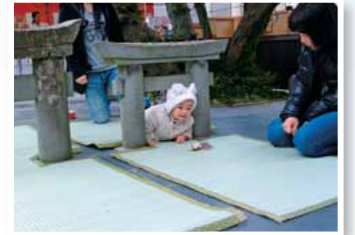
粟嶋神社 安産や子宝、無病息災にご利益があると と言われるミニ鳥居くぐりが有名