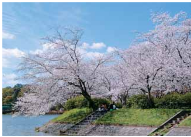
立岡自然公園 約2千本の桜が咲き誇る県下屈指の桜の名所