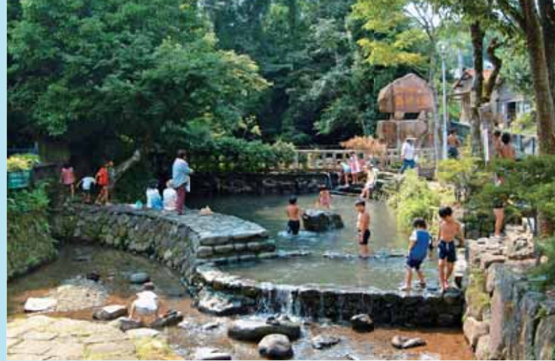
●日本名水百選に選ばれた「轟水源」