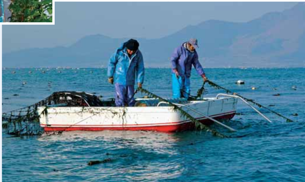
●「有明のり」で有名なのり養殖

また、地産地消の強化、あるいは都市と農村の交流を深めるなどといった生産者と消費者との連携により、流通・販売ルートの拡大を推進しています。