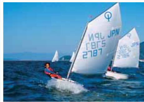
マリンスポーツ 宇土マリーナでは、ヨットのほかクルージングも楽しめる