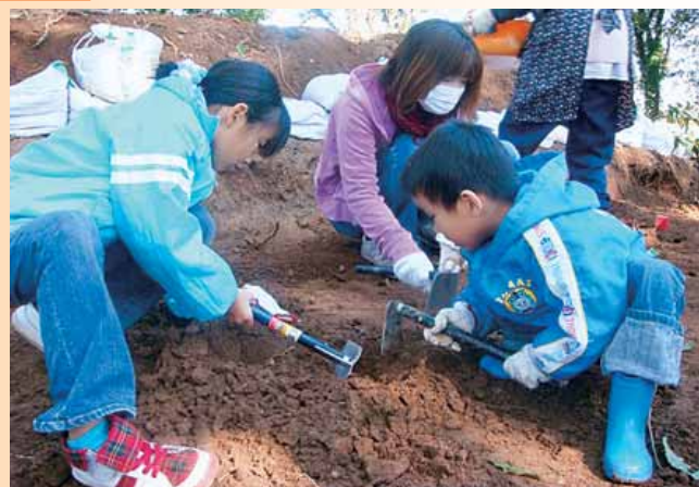
●国史跡として、昭和54年に指定された「中世宇土城跡(西岡台)」で発掘体験