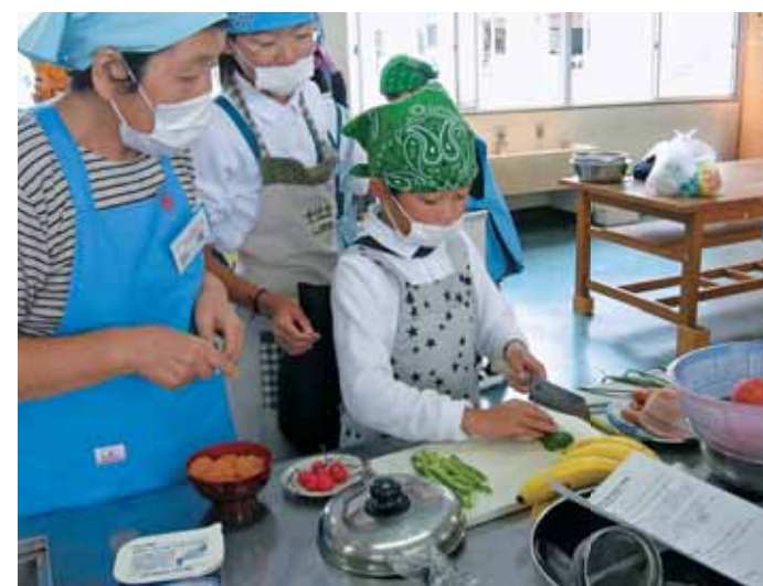
●ヘルスマイト（食生活改善推進員）による料理教室