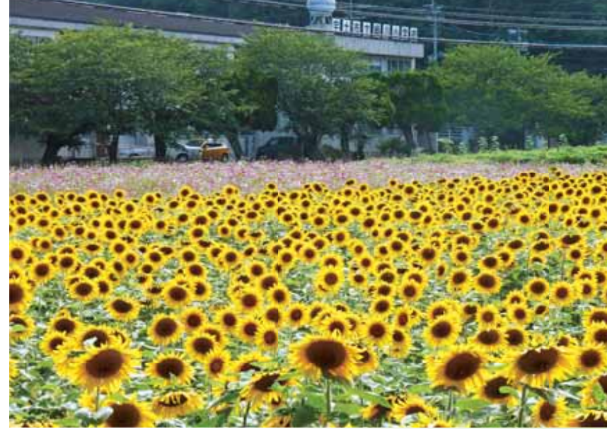
●地域みんなで美しいまちづくりに取り組む「花いっぱい運動」

熊本県のそして九州のほぼ中央に位置する地理的条件を活かし、さらなる広域拠点性を高め、快適で利便性に富んだ都市づくりを推進するとともに、良好な居住環境の整備に取り組んでいます。