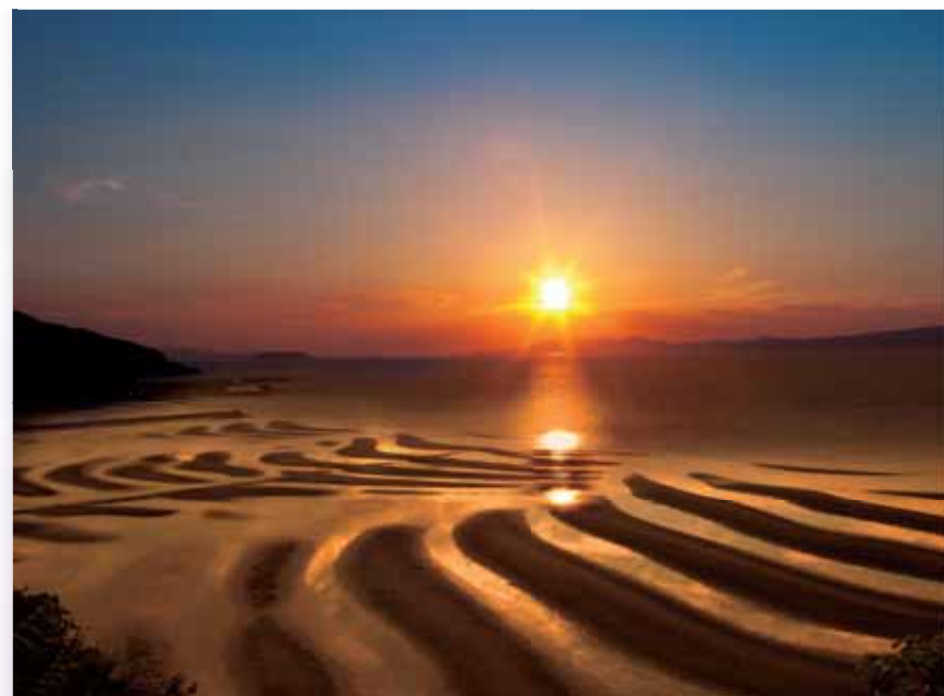
御輿来海岸 日本渚百選に選ばれた海岸