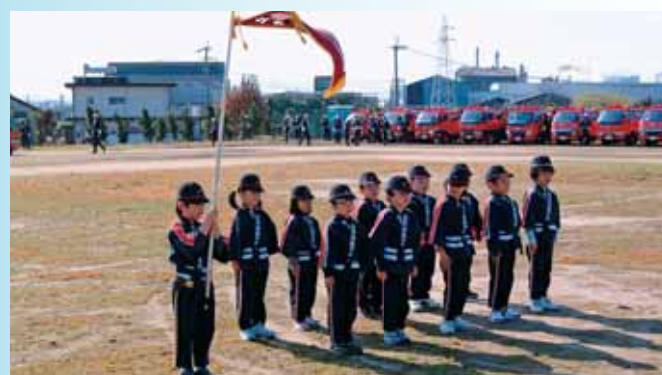
●地域で活躍する消防団による「消防点検」