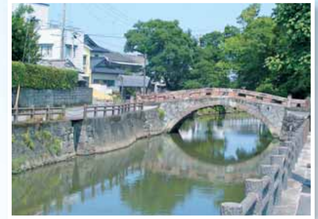
船場橋(めがね橋) 文久元年に架橋され、今なお昔の面影を残す。 赤味を帯びた馬門石の輪石が特徴