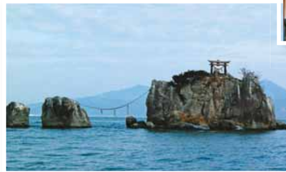
風流島 住吉自然公園から見る ことができる無人の小島。 枕草子や伊勢物語にも詠われている