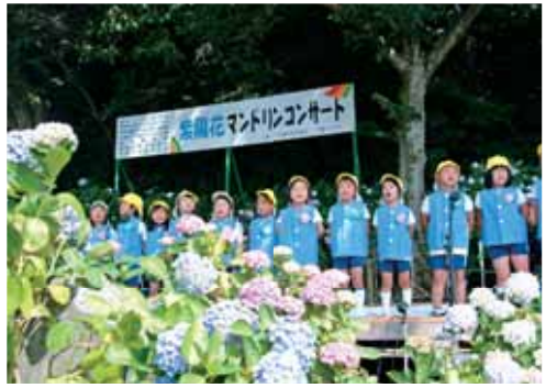
住吉あじさい公園 毎年、6月中旬に紫陽花マンドリンコンサートを開催