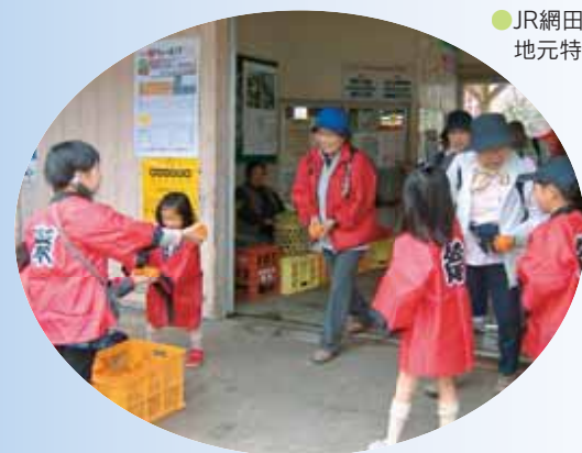
●JR網田駅で子どもたちが地元特産のネーブルをPR