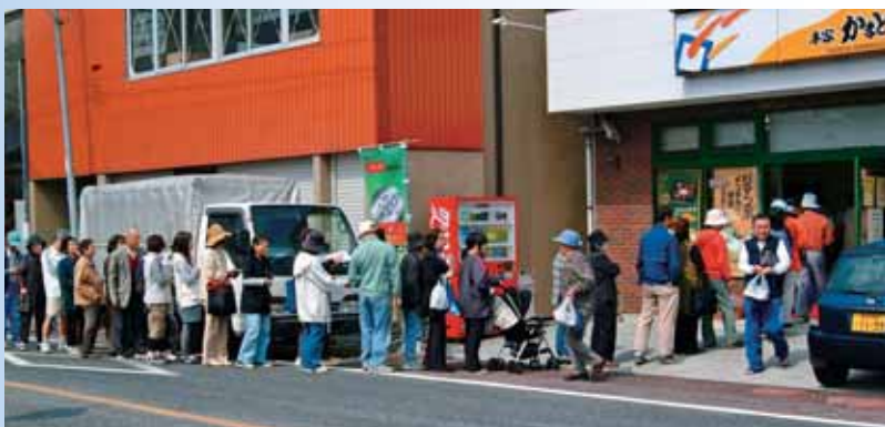
●商店街活性化事業の一つである「うと100円商店街」