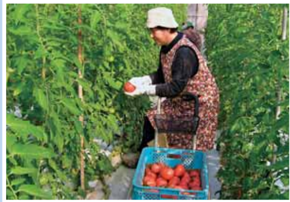
●特産品トマトの収穫