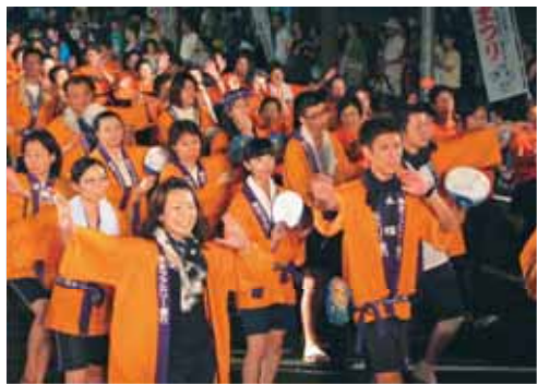
うと地藏まつり 約360年の歴史がある肥後三大夏祭りの一つ