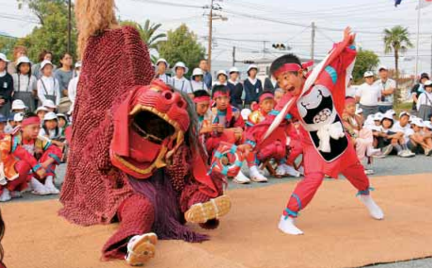
●勇壮に舞う「宇土の御獅子舞」(西岡神社大祭)