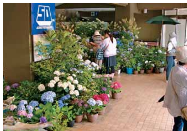
●世界のあじさいでまちづくり