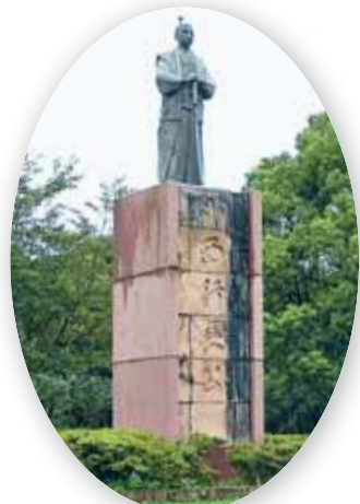
●豊臣秀吉の家臣として名高いキリシタン大名「小西行長」