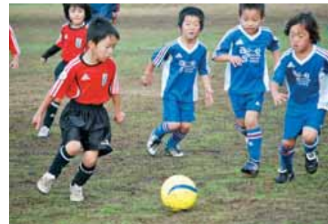
●宇土マリーナで開催されるジュニアサッカー