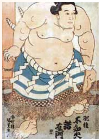
●「不知火型土俵入り」の創始者といわれる第八代横綱「不知火諾右衛門」