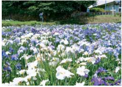
菖蒲園 轟泉自然公園の一角にある菖蒲園