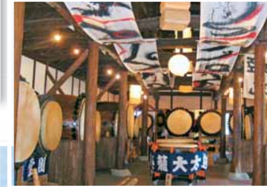
大太鼓収蔵館 26基の大太鼓を収納