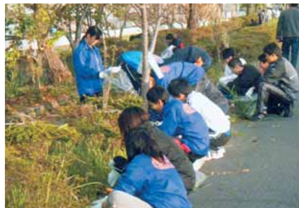
●「船場川クリーン作戦」