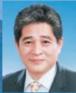
熊本県宇土市長 元松 茂樹