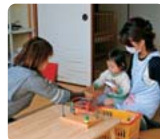
●病児・病後児保育 病気や病気の回復期で家庭で保育ができない児童をお預かりします