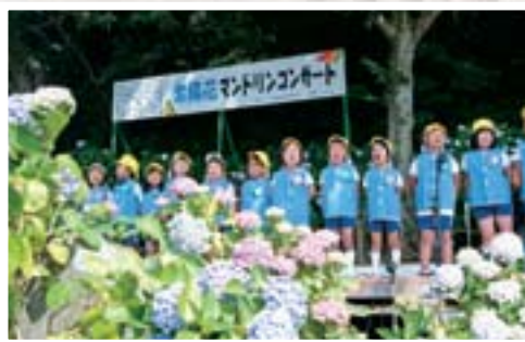
住吉自然公園 毎年、6月中旬に紫陽花マンドリンコンサートを開催