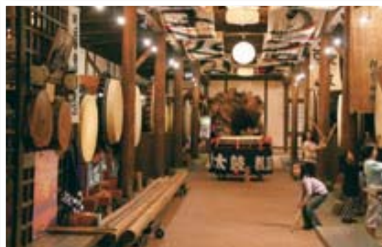
大太鼓収蔵館 26基の大太鼓を収納