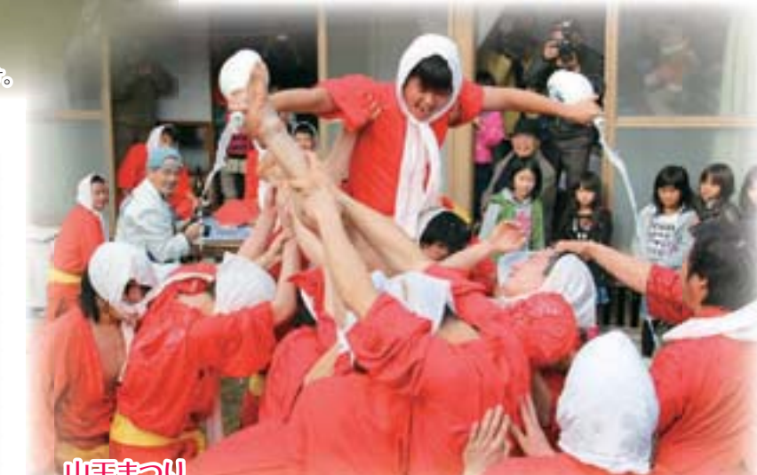
山王まつり 旧暦の11月申の日に山王神社で行われる。申に扮した若者たちが「ホーライ、ホーライ」の掛け声とともに徳利を奪いあい、甘酒を掛けあいながら、無病息災を願う