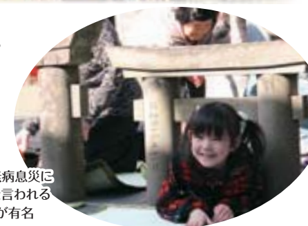
粟嶋神社 安産や子宝、無病息災に ご利益があると言われる ミコ鳥居くくりが有名