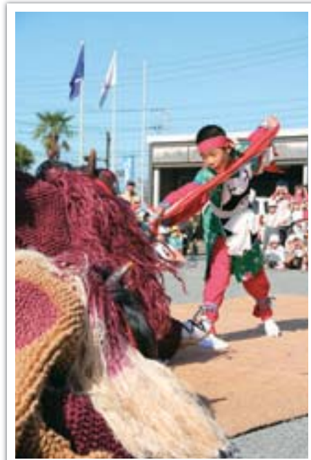
●勇壮に舞う「宇土の御獅子舞」(西岡神社秋季例大祭)