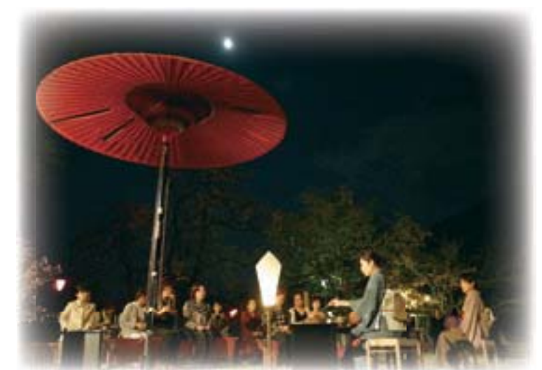
名月茶会 箏と尺八の優雅な調べを聴きながら、 轟水源の水でたてたお茶を満喫