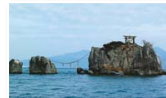
風流島 住吉自然公園から見ることできる無人の小島。 枕草子や伊勢物語にも詠われている