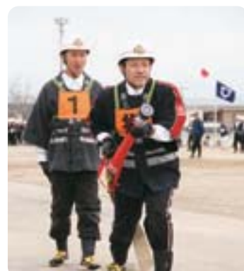
●地域で活躍する消防団による「消防点検」