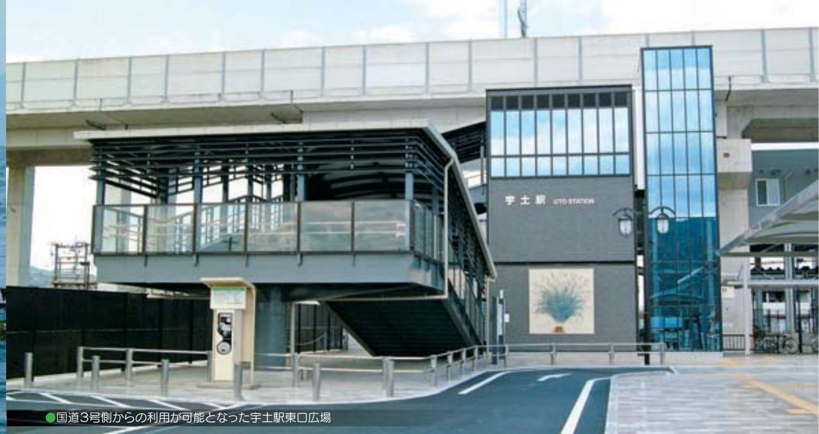
●国道3号側からの利用が可能となった宇土駅東口広場