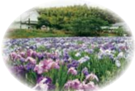
菖蒲園 轟泉自然公園の一角にある菖蒲園