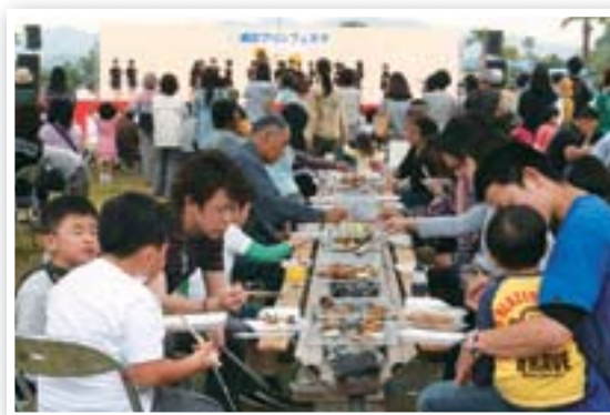
マリンフェスタ 宇土マリーナで開催