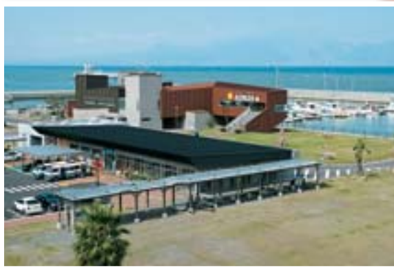
道の駅 宇土マリーナ 平成18年には宇土マリーナ物産館「おこしき館」もオープン