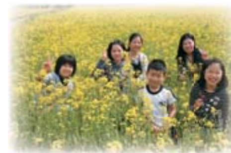
●まちおこしグループが網田駅南側水田一帯に菜の花を植栽