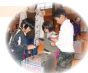
●選挙への関心を深めてもらおうと緑川小学校で行われた「給食のデザートを決める模擬選挙」

地方分権が進展していく中で、市民の主体的なまちづくりへの参画と協働など、市民、事業者、行政など本市を構成するみんなの力でまちづくりを進めていく必要があります。このため、積極的に情報の共有化を進めるとともに、協力しながら魅力あるまちづくりに取り組んでいます。