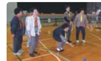
●市福祉スポーツ大会 (屋内ペタンク競技)