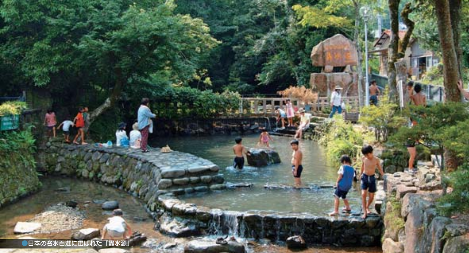
●日本の名水百選に選ばれた「轟水源」