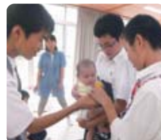
●高校生の赤ちゃんふれあい体験 未来を担う若い世代にも子育ての楽しさ、大変さを体感してもらうことを目的とした「高校生の赤ちゃんふれあい体験」

安心して子どもを産み育てることができるよう、子どもたちの心身が健やかに育まれるよう、地域全体で子育てを支援する環境の整備に取り組んでいます。