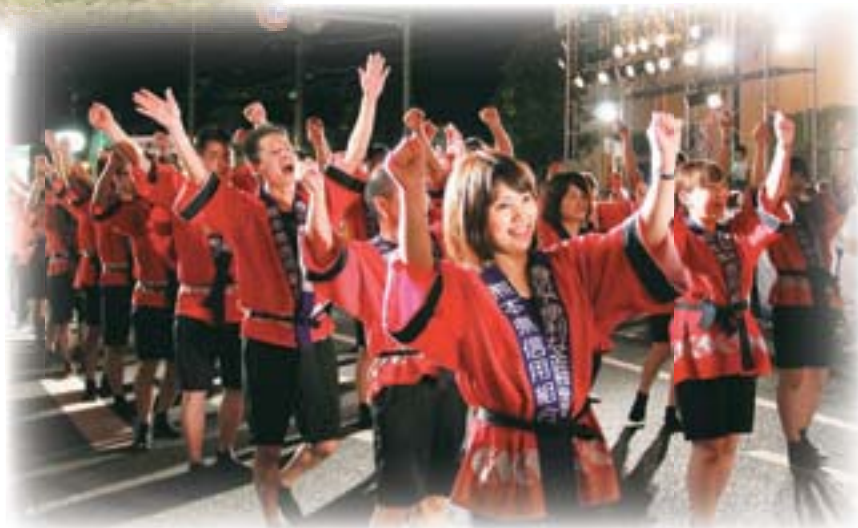
うと地蔵まつり 約360年の歴史がある肥後三大夏祭りの一つ