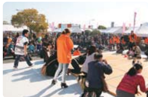
●宇土シティモール駐車場で開催された「うと産業祭2012 わいわいフェスタ」