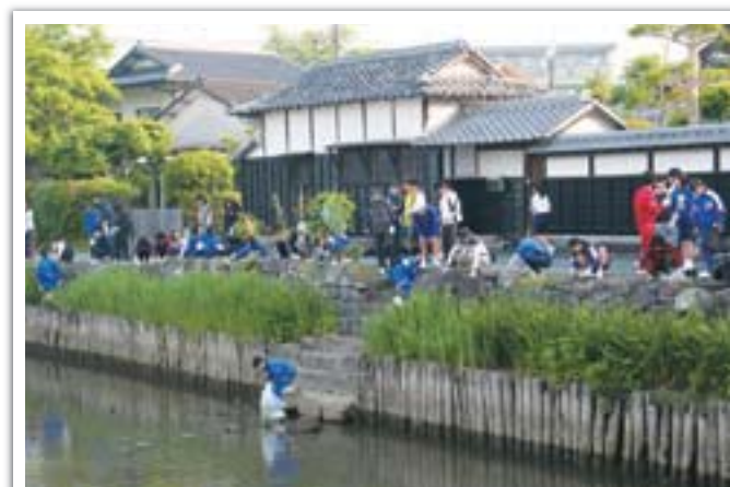
●「船場川クリーン作戦」