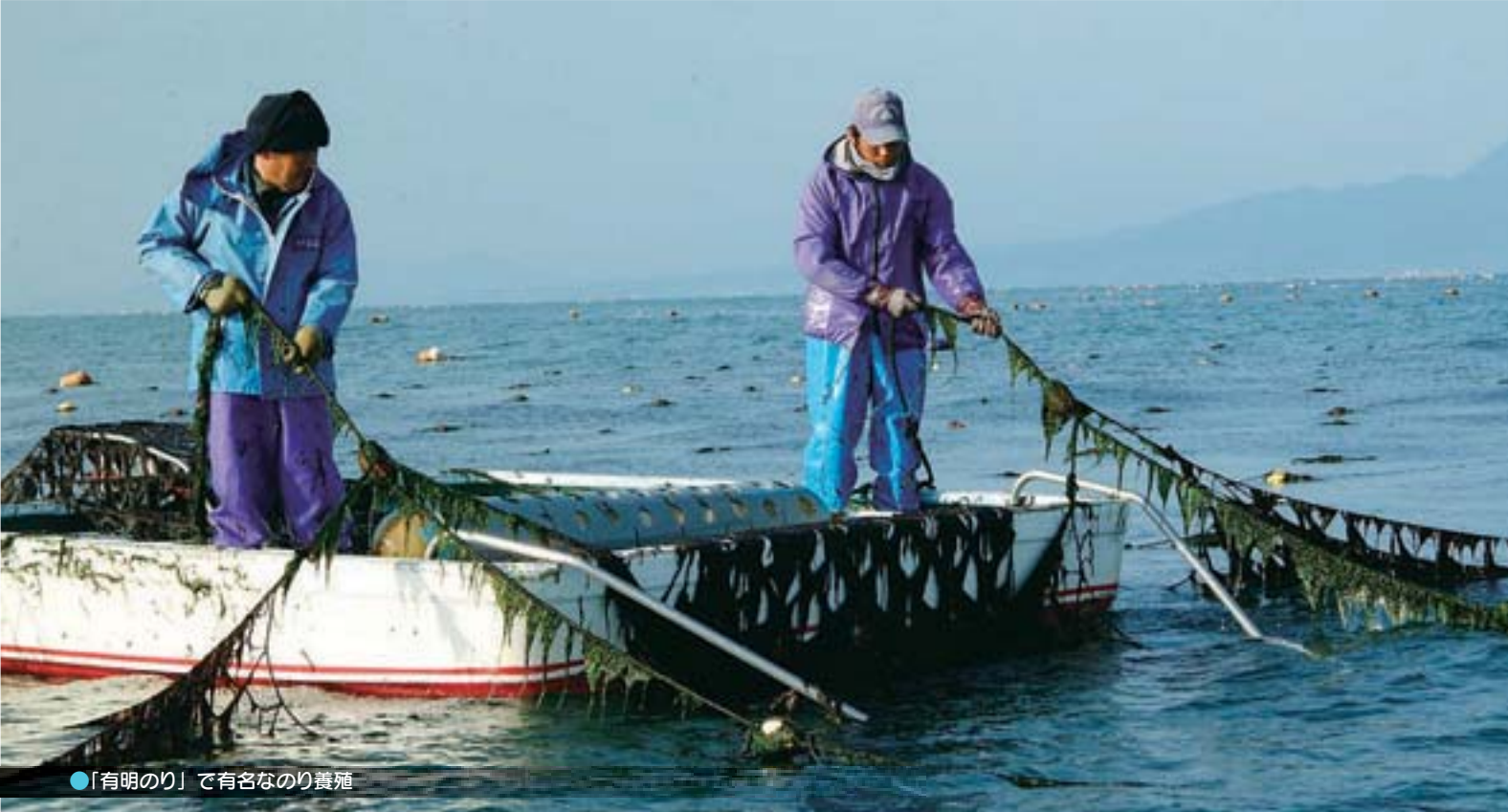
●「有明のり」で有名なのり養殖