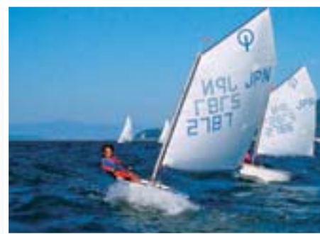
マリンスポーツ 宇土マリーナでは、ヨットのほか クルージングも楽しめる