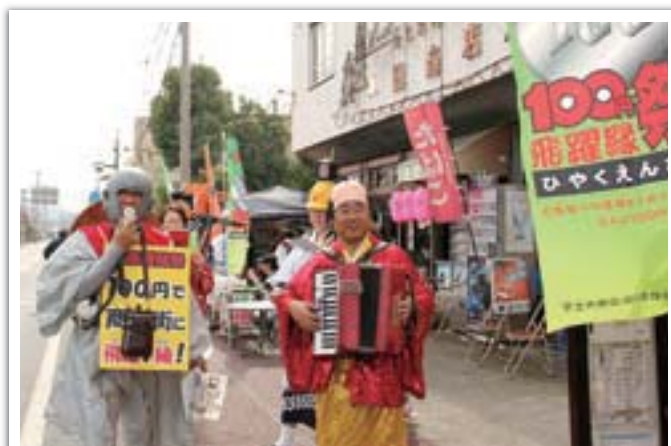
●商店街活性化事業の一つである「うと100円商店街」