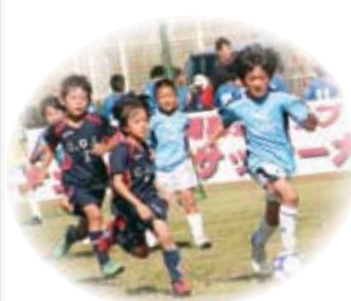
●宇土マリーナで開催されるジュニアサッカー

また、「郷土を愛する心、豊かな心を持った世界に羽ばたく人を育む」を基本理念とした「市教育立市プラン」の実現に向けて、子どもたちの生きる力を育む教育、郷土の文化・歴史、人の素晴らしさを再認識できる教育環境、そして生涯学習の推進に取り組んでいます。