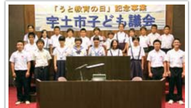
●子どもの自由な発想や視点から捉えた質問や意見を発表する「子ども議会」