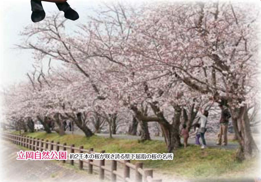
立岡自然公園 約2千本の桜が咲き誇る県下屈指の桜の名所

私たちは、より多くの人に宇土市の魅力を知っていただきたいと情報発信に努めています。