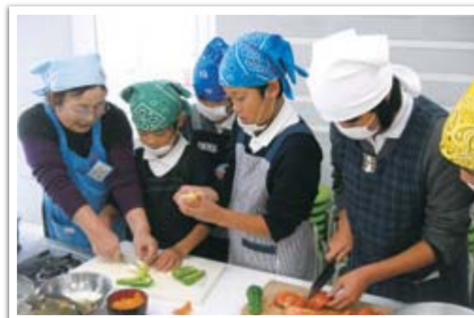
●ヘルスマイト(食生活改善推進員)による料理教室