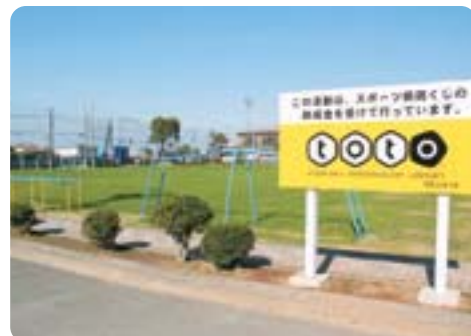
●走瀧小学校校庭の芝生化