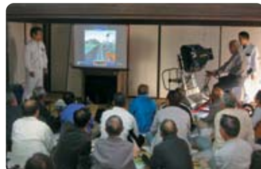
●各地区で行われる「交通安全・防犯教室」