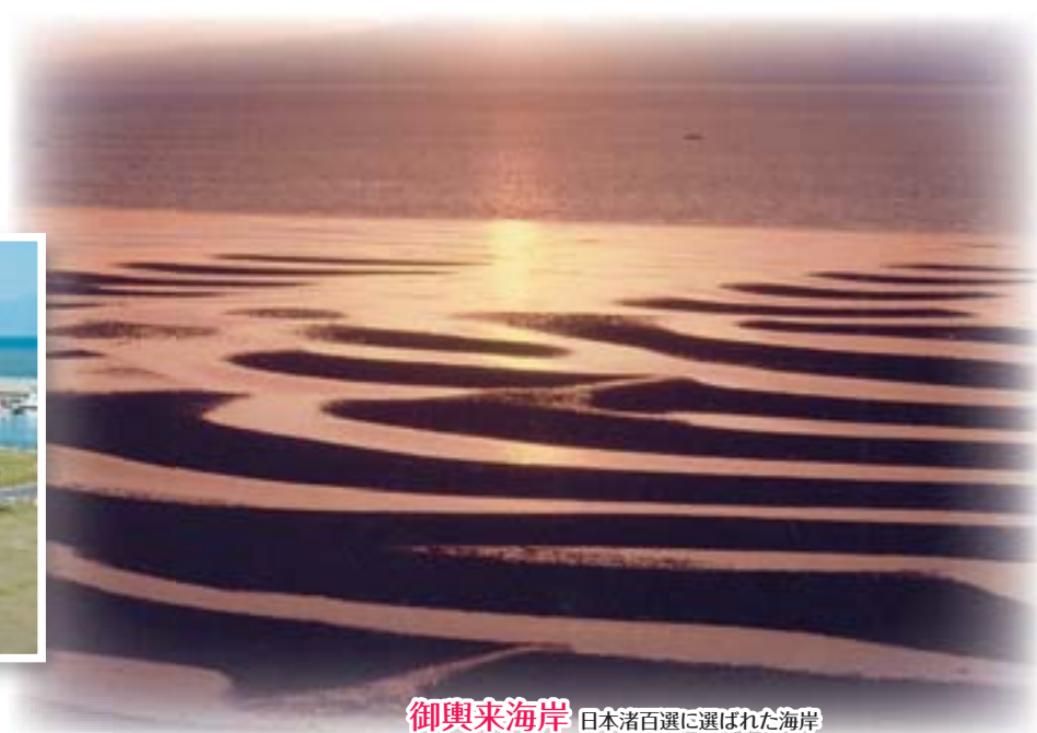
御輿来海岸 日本渚百選に選ばれた海岸