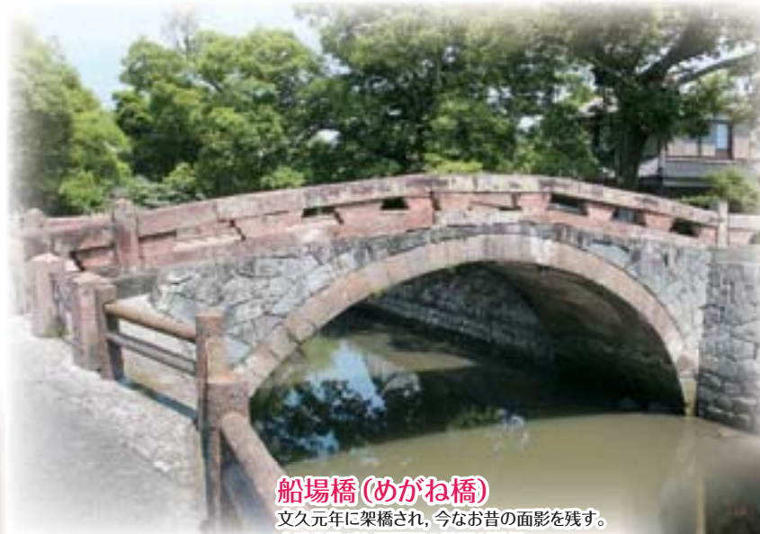
船場橋(めがね橋) 文久元年に架橋され、今なお昔の面影を残す。 赤味を帯びた馬門石の輪石が特徴