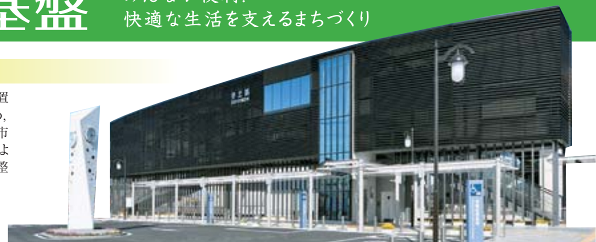
●新しくなった宇土駅西口広場。中心市街地に通じる宇土駅本町線も含め駅西側が再生

熊本県のほぼ中央に位置する地理条件を活かすため、快適で利便性に富んだ都市づくりを推進するとともに、より安全で良好な居住環境の整備に取り組んでいます。