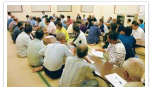
●「市民ふれあい座談会・市長と話そう！」