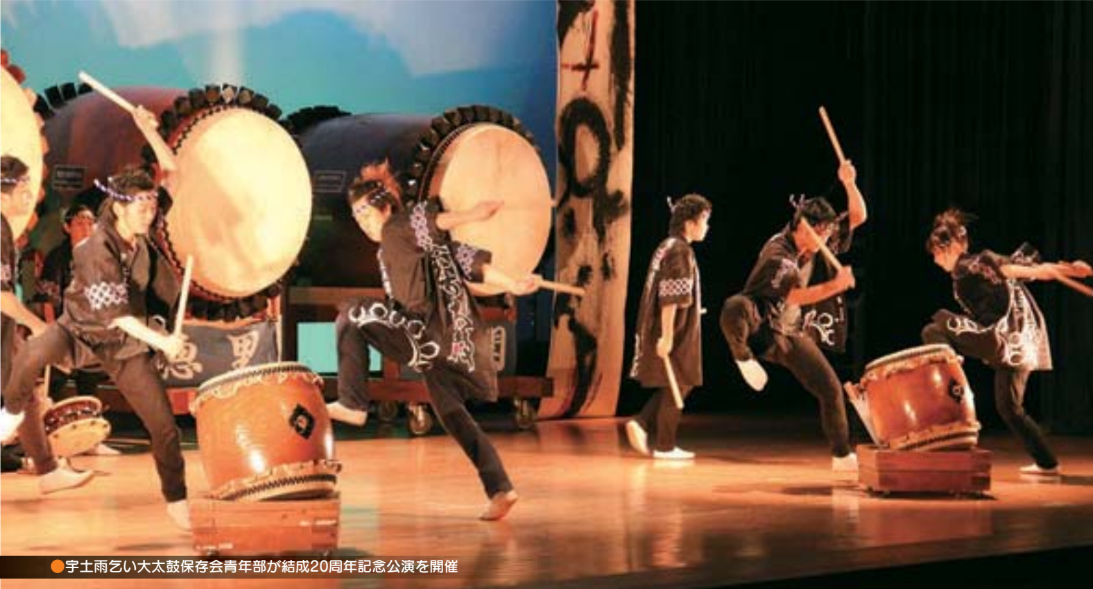
●宇土雨乞い太鼓保存会青年部が結成20周年記念公演を開催