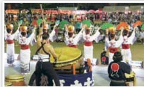
大太鼓フェスティバル 毎年、8月第1土曜日に開催