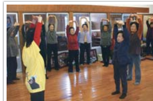
●介護予防サポーターを養成

高齢者や障がい者(児)が住みなれた地域社会で生きがいを持ち、安心して自立した暮らしができるよう、社会参加の拡大と生きがい対策を推進するとともに、地域全体で支援する体制の確立や支援サービスの充実に取り組んでいます。