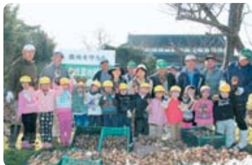
●耕作放棄地でジャガイモを収穫