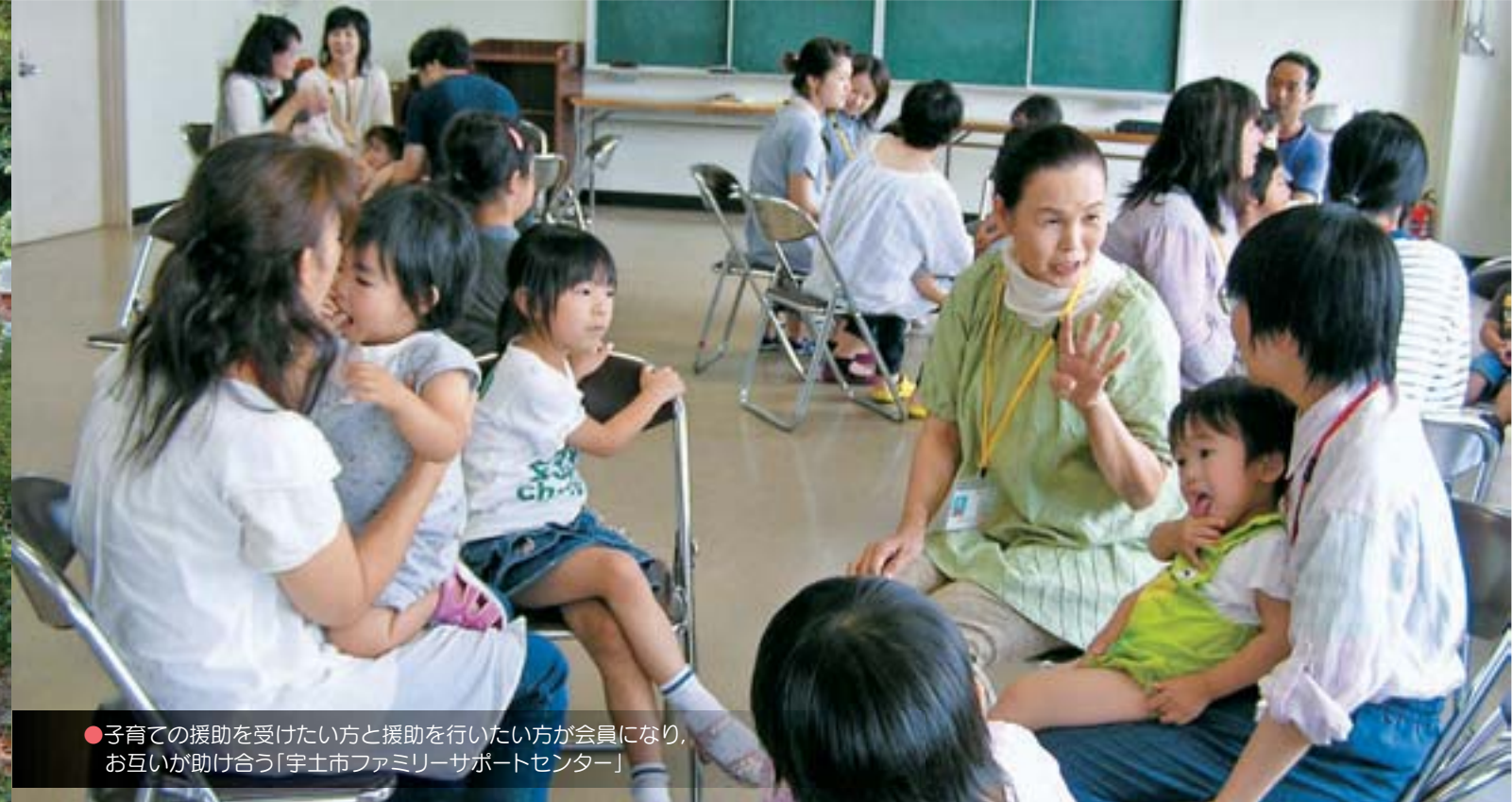
●子育ての援助を受けたい方と援助を行いたい方が会員になり、お互いが助け合う「宇土市ファミリーサポートセンター」