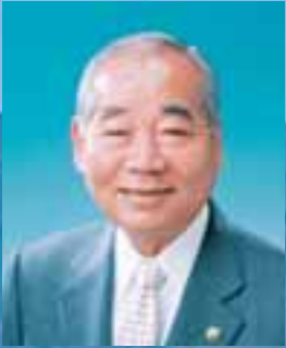
熊本県宇土市長 田口 信夫