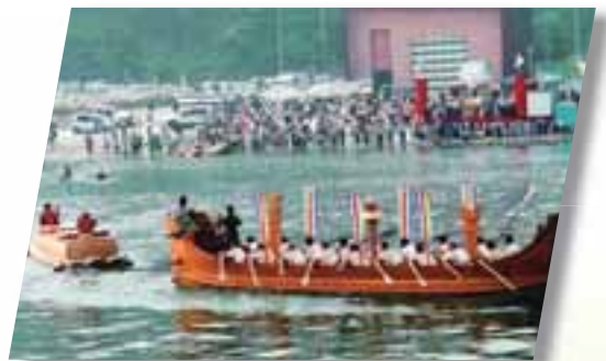
■大王のひつぎ実験航海