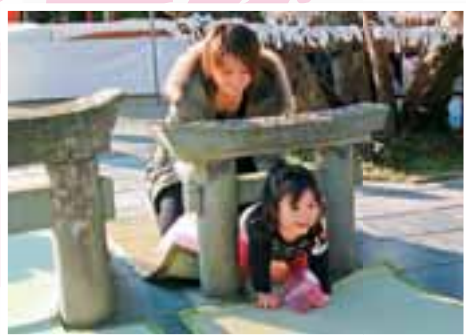
粟嶋神社 安産や子宝、無病息災にご利益があると言われる ミニ鳥居くぐりが有名