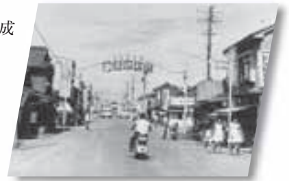
■市制施行当初の商店街