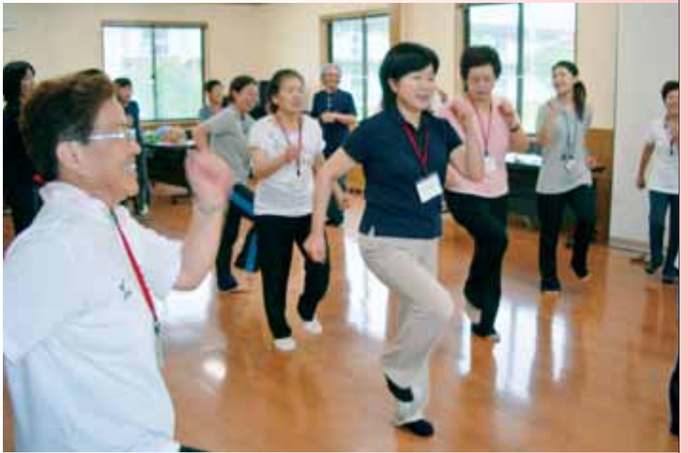
●介護予防サポーターを養成