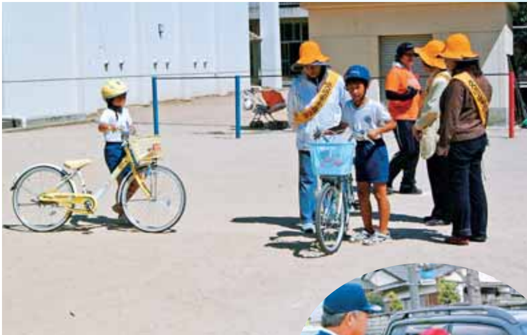
●小学生を対象とした「子ども自転車教室」