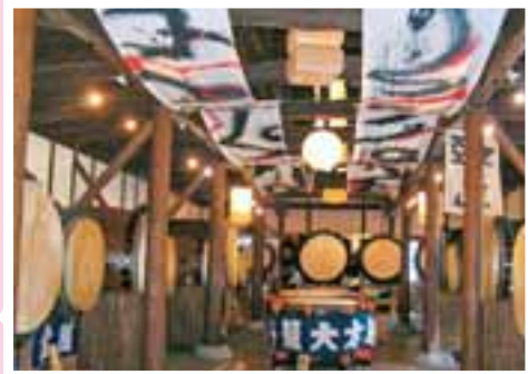
大太鼓収蔵館 26基の大太鼓を収納

私たちは、より多くの人に宇土市の魅力を知っていただきたいと、情報の発信に努めています。