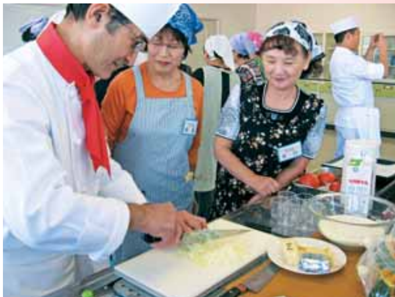
●ヘルスマイト （食生活改善推進員） による料理教室

メタボリックシンドロームの抑制や食育に重点を置き、市民の自主的な健康づくりが進められるよう取り組んでいます。