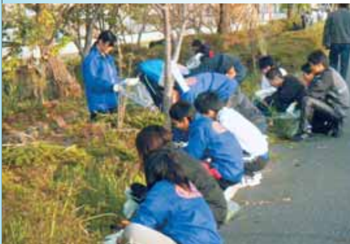
●「船場川クリーン作戦」