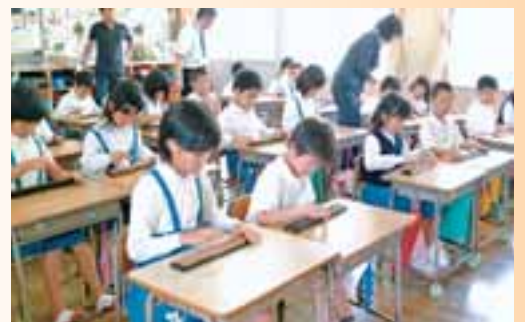
●小中学校で取り組むそろばんの時間