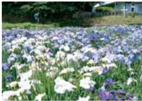
菖蒲園 轟泉自然公園の一角にある菖蒲園