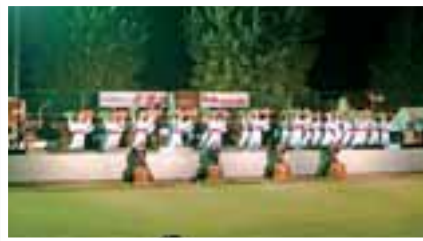
宇土太鼓フェスティバル 毎年、8月第1土曜日開催