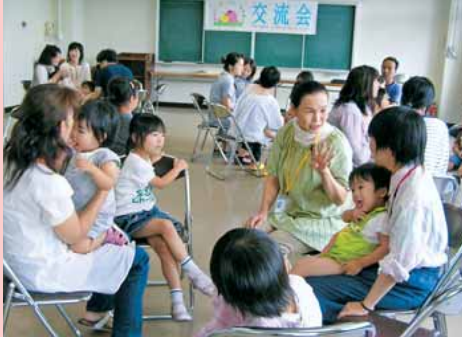
●第1回交流会の風景