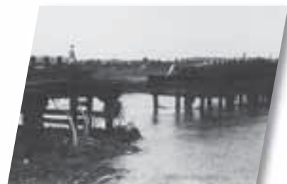
■豪雨により流失した平木橋