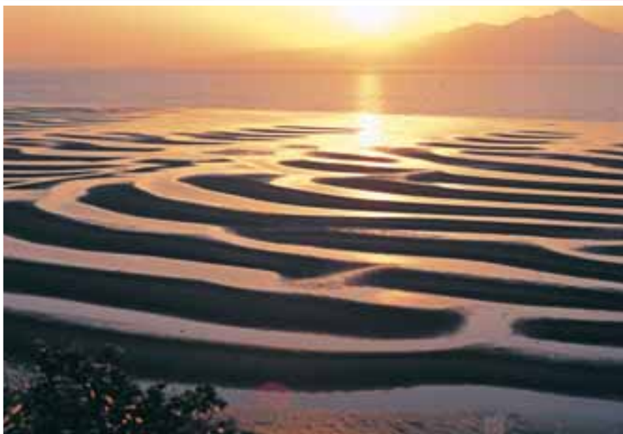
御興来海岸 日本渚百選に選ばれた海岸