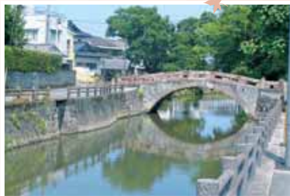
船場橋（めがね橋） 文久元年に架橋され、 今なお昔の面影を残す。 赤味を帯びた馬門石の 輪石が特徴