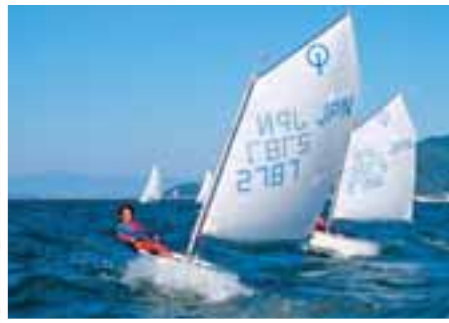
マリンスポーツ 宇土マリーナでは、ヨットのほかクルージングも楽しめる