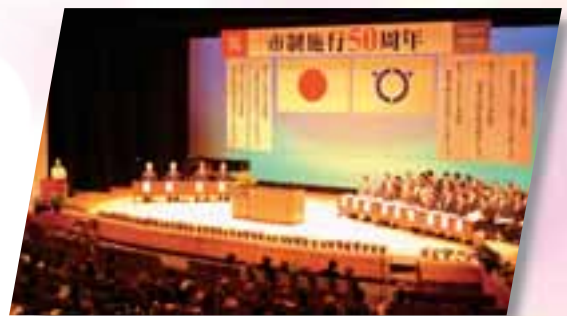
■宇土市制施行50周年