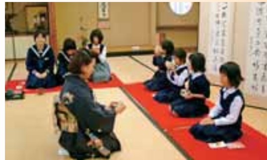
●日本の伝統文化である華道・茶道を体験する子どもたち。