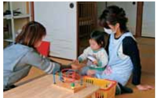
●子育て講座「ベビーマッサージ」の風景