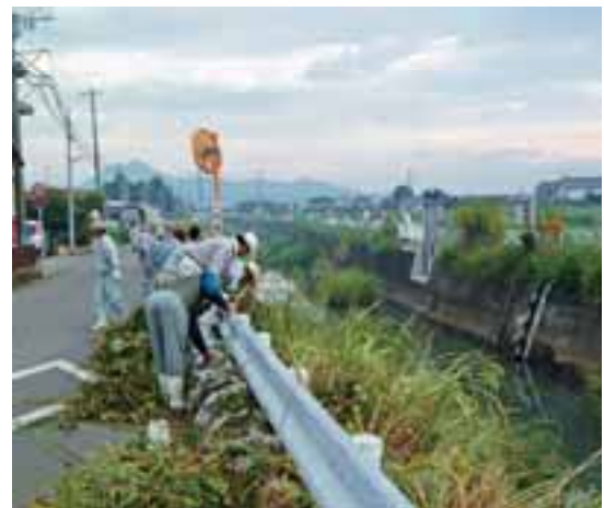
●「くまもと・みんなの川と海づくりデー」