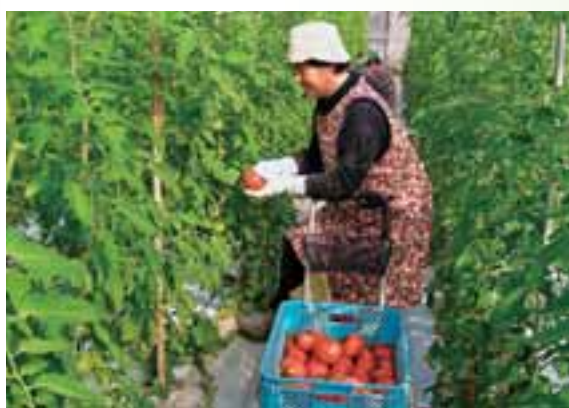
●特産品トマトの収穫