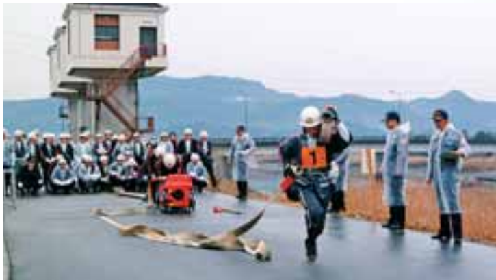
●地域で活躍する消防団による「消防点検」