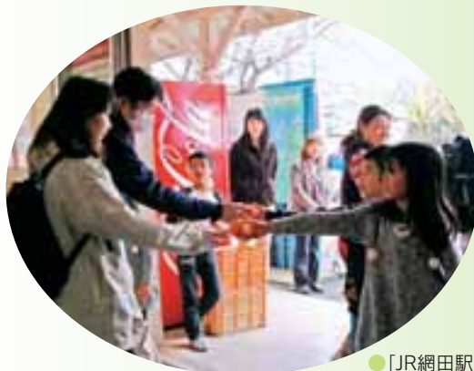
●「JR網田駅で子どもたちが地元特産のネーブルをPR」