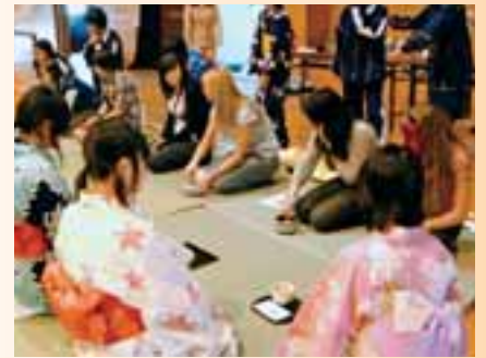
●国際交流も積極的に実施