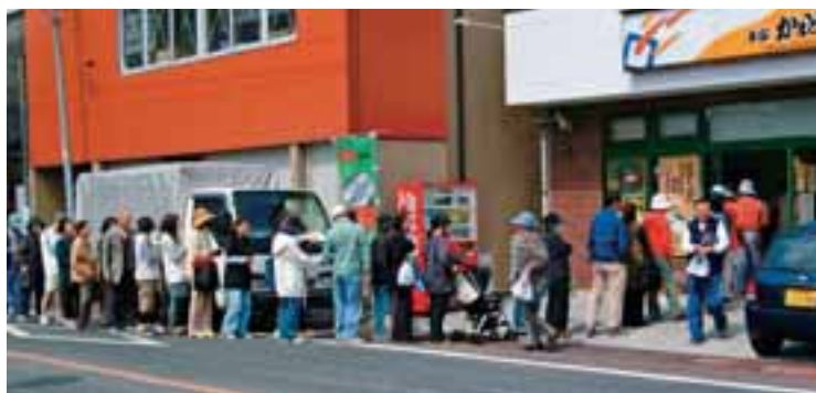
●商店街活性化事業の一つである「うと100円商店街」

また、地産地消の強化、あるいは都市と農村の交流を深めるなどといった生産者と消費者との連携により、流通・販売ルート拡大を推進しています。