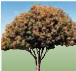
市の木 (きんもくせい)