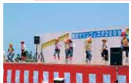
マリノフェスタ 宇土マリーナで開催