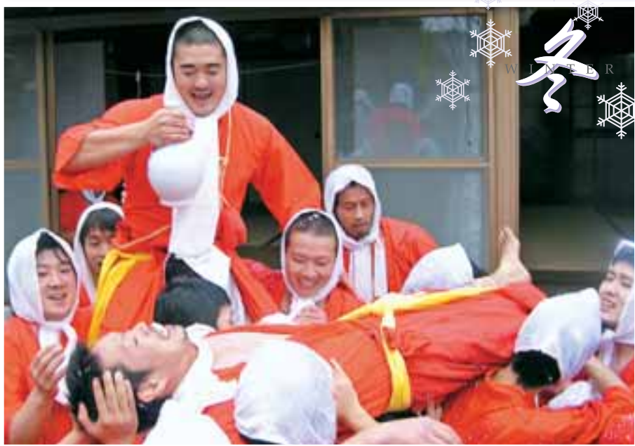
甘酒まつり 旧暦の11月申の日に山王神社で行われる。申に扮した若者たちが「ホーライホーライ」の掛け声とともに徳利を奪いあい、甘酒を掛けあいながら、無病息災を願う