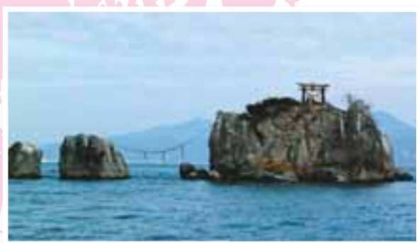
風流島 住吉自然公園から見る ことができる無人の小島。 枕草子や伊勢物語にも 詠われている