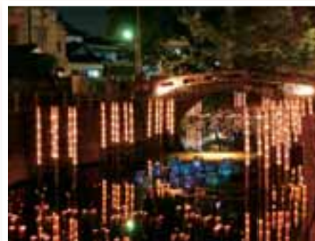
船場川浮き灯籠 船場川に数千個の竹灯籠 が浮かび、幻想的な雰 囲気を醸し出しています