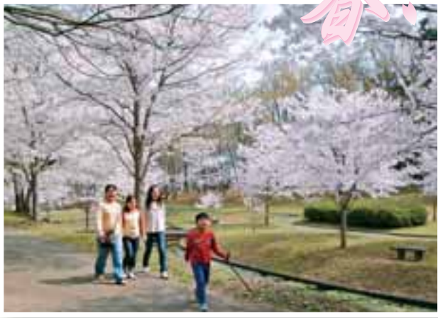
立岡自然公園 約2千本の桜が咲き誇る県下屈指の桜の名所