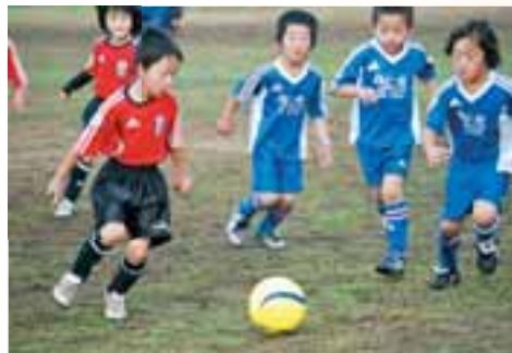
●宇土マリーナで開催されるジュニアサッカー