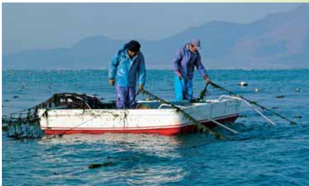
●「有明のり」で有名なのり養殖