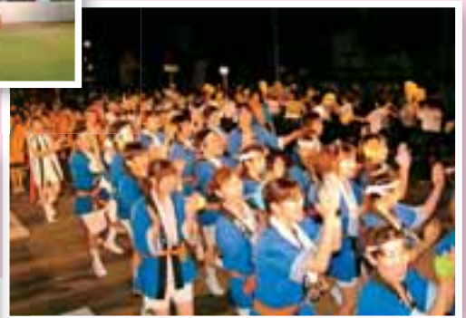
うと地藏まつり 約360年の歴史がある肥後三大夏祭りの一つ