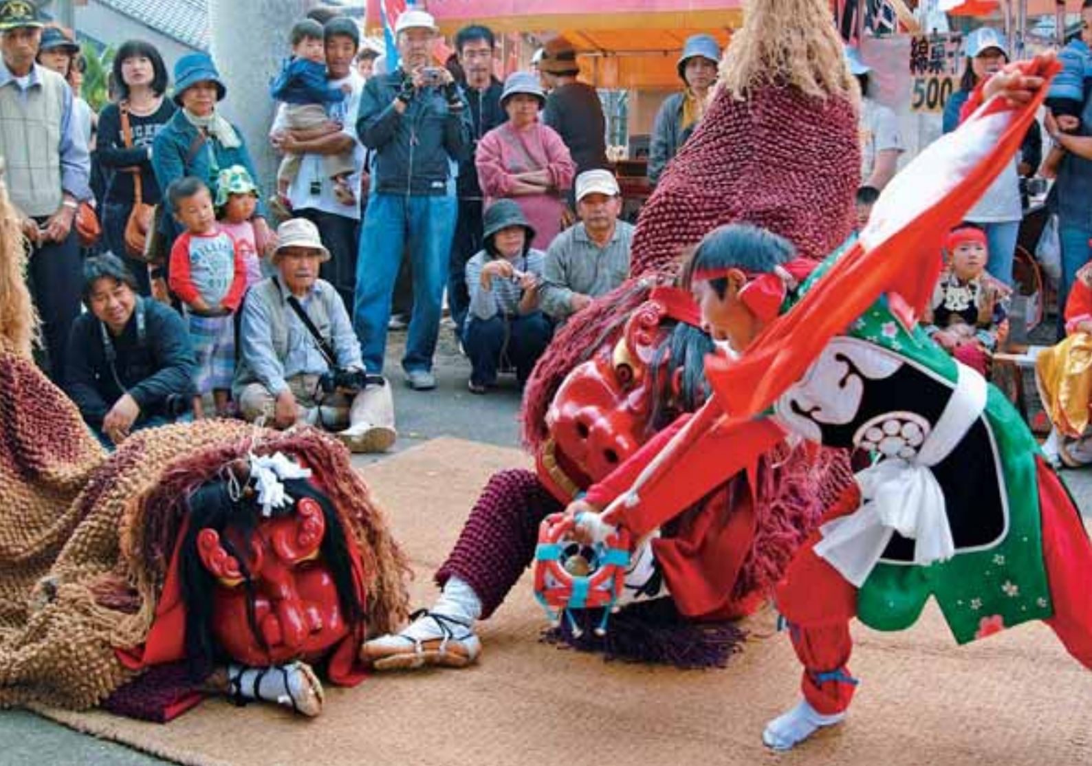
●勇壮に舞う「宇土の御獅子舞」（西岡神社大祭）