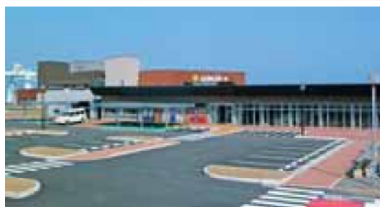
道の駅 宇土マリーナ 平成18年には宇土マリーナ物産館「おこしき館」もオープン