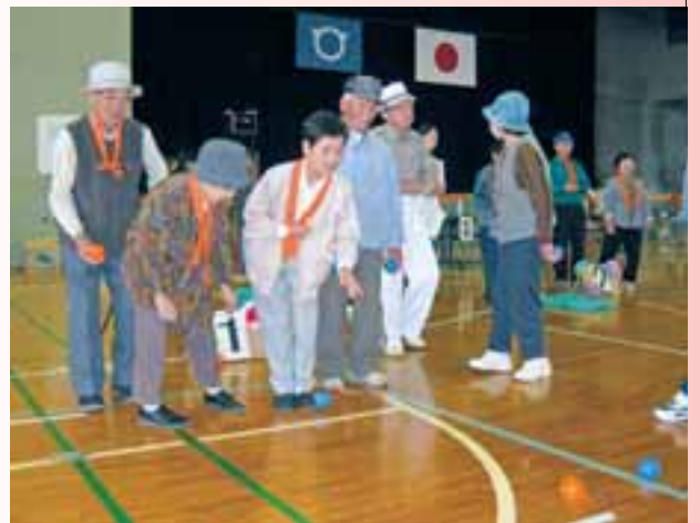
●市福祉スポーツ大会（屋内ベタンク競技）

また、共に支えあう暮らしを実現するため、保健・医療・福祉の関係機関と連携を深め、地域交流を図りながら、支援サービスの充実に努めています。