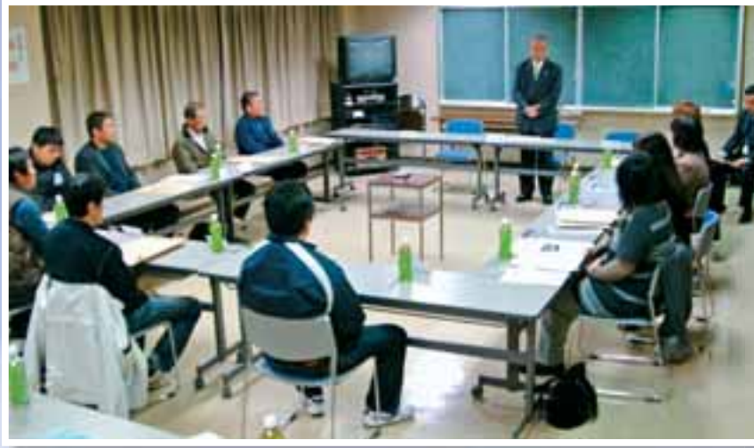
●「市政モニター会議」 市民の皆さまの意見を市政に反映させています。