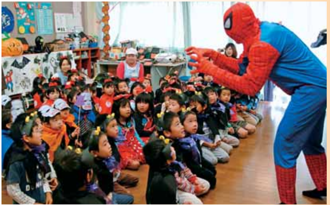
●国際理解を深め、グローバルな人材育成を目的とする「外国語教育」