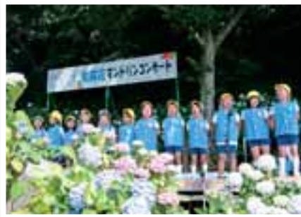
住吉あじさい公園 毎年、6月中旬に紫陽花マンドリンコンサートを開催