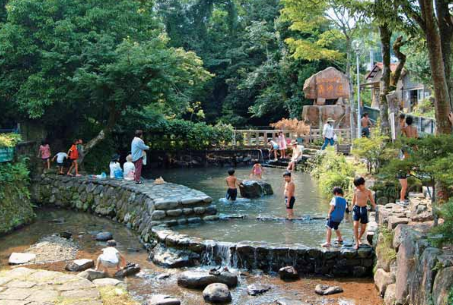
●日本名水百選に選ばれた「轟水源」