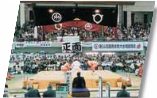
■第54回国民体育大会