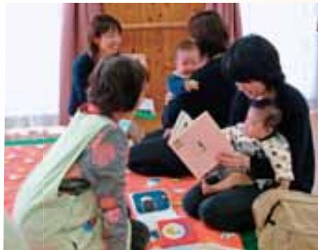
●親子がふれあいながら、感性を磨き、豊かな心を育むことを願う「ブックスタート」