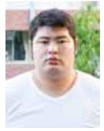
尾上部屋の竜虎 (2016 国体出場時の写真)

若者が夢を持ち続け、その実現に向け挑戦しやすい環境を作っていかなければならないと改めて感じています。