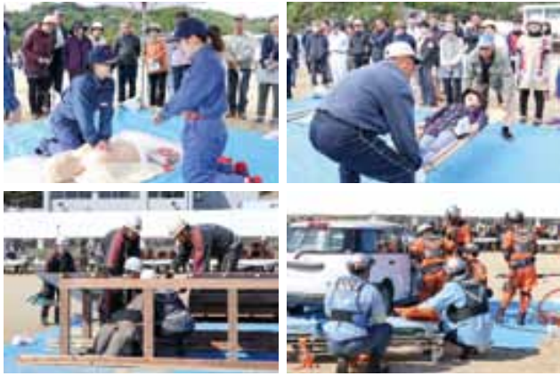
総合防災訓練で実施された救命訓練