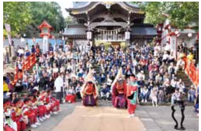
西岡神宮で披露された宇土御獅子舞

10月19日、西岡神宮の秋季例大祭が開催され、県指定重要無形民俗文化財の「宇土御獅子舞」が市内5箇所披露されました。この獅子舞は、1740年に宇土藩主の細川興文公が五穀豊穡と子孫繁栄などを祈願して奉納したのが始まりとされ、現在では本町1丁目の住民を中心とした保存会により継承されています。大祭当日は、氏子らの神幸行列が市内中心部を練り歩き、西岡神宮境内では飾り馬の奉納や流鏝馬が披露され、参拝者たちから歓声や拍手が送られました。