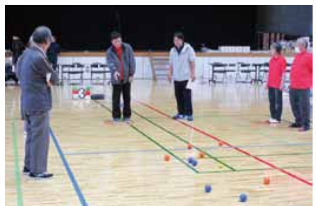
ペタンク競技を楽しむ参加者