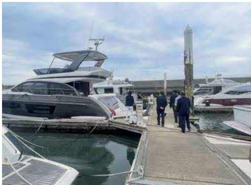
来年度中に撤去予定の老朽化したくし型浮き桟橋

問 農業経営基盤強化構想の進捗状況と、有機農業の取組状況、若い農業者が安心して農業に挑戦できる環境づくりについて、市の考えを問う。 答 農地集積、担い手や新規就農者確保に取り組んでいるが、一方で非合法的な農地貸借も多く、集積状況の正確な把握が課題である。有機農業については、みどりの食料システム戦略を推進するため、化学肥料や農薬の使用を抑えるなど、環境負荷の低減に計画的に取り組む「みどり認定」を受ける農業者を増やすことが重要であると考えている。また、農地中間管理機構との連携や耕作放棄地対策を進め、生産基盤の維持・強化と本市の農業の持続的発展を目指す。（経済部長）