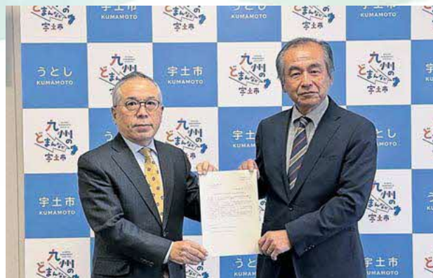
中熊 聡 選挙管理委員会委員長へ