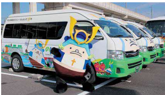
ミニバス「のんなっせ」

答 長期的な視点に立った見直しについては市の計画に位置付けた上で、地域公共交通会議等において承認を得た後、国の認可を得るという流れのため、少なくとも1年以上の時間を要するが、松山から宇土駅までのルートについては、最優先で検討すべきだと考えている。（企画財政部長）