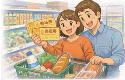
物価高対策を迅速にお届けしてください！

答 本交付金は物価高に苦しむ市民生活を支えるところに重点があるので、可及的速やかに取り組めるよう準備を進める。報道されているおこめ券は、農村部のある本市には適切でないため、商品券を考えている。