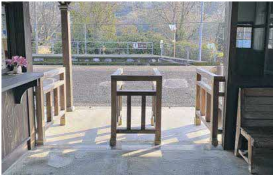
三角線には自動改札機が無い。硬券切符の復活を！

問 JR三角線の1km当たり1日平均乗客数が現在千人を切り、このままでは代替交通を議論する国の再構築協議会設置のおそれもある。この状況下、市は何ら対策を講じていない。担当課は無いに等しい。責任ある体制の構築を望む。また沿線人口は減少の一途、通勤通学等で利用する生活列車だけでは限界があり、今後は観光列車に置きを置いた取組が存続の鍵となる。そこで提案として、三角線の駅には自動改札機が無い。つまりICカードが使えない。これを逆手に取り三角線に昔存在した硬券切符による不便なシステムを導入する。将来的には国鉄時代の古い車両を走らせ、九州最古級の木造駅舎網田駅を観光の柱に据えて新たな活路を見出す。何でも便利