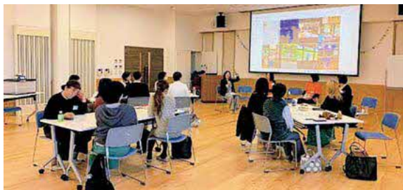
11/15 第3回うとみらいカレッジ

答 本市には男女共同参画専任部署がなく、これまで取組は十分であったとは言えない。今年度は新たな一歩として「うとみらいカレッジ」を実施し、参加者からも一定の評価を得た。現行体制で事業展開を図る中で、組織強化が必要となった際は、来年度以降、専任部署の新設も含め検討する。