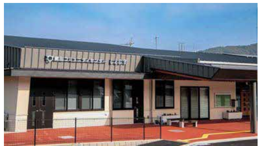
網田コミュニティセンター

問 年金システム改修委託料について、この委託料は、特定の1社との契約になるのか。