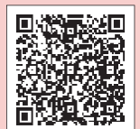
議会議録画映像アーカイブ