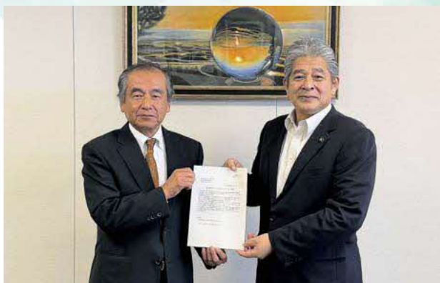
元松 茂樹 市長へ

11月4日(火)付けで、議長から市長及び選挙管理委員会へ、選挙運動費用に対する公費負担の制度化に関する要望書を提出しました(上記参照)。