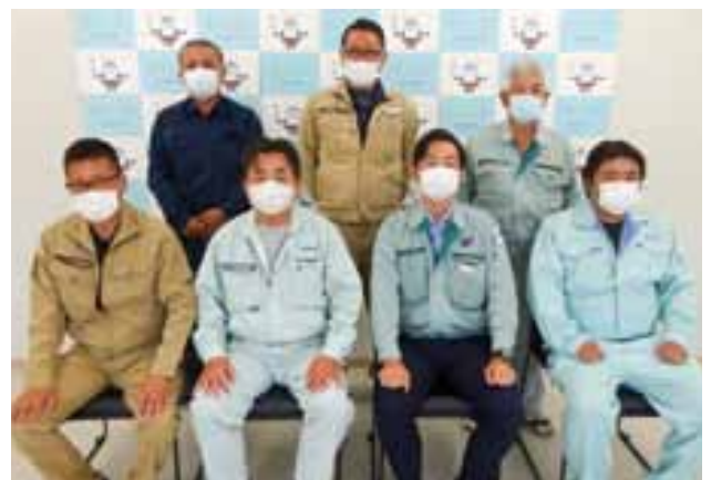
受賞された建設業者のみなさん