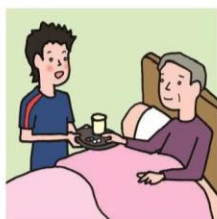
がん・難病・精神疾患など慢性的な病気の家族の看病をしている