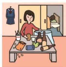
アルコール・薬物・ギャンブル問題を抱える家族に対応している