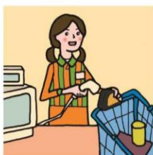
家計を支えるために労働をして、障がいや病気のある家族を助けている