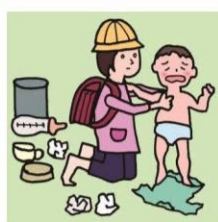
家族に代わり、幼いきょうだいの世話をしている