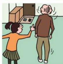
目を離せない家族の見守りや声かけなどの気づかいをしている