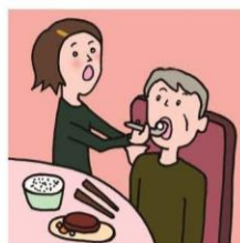
障がいや病気のある家族の身の回りの世話をしている