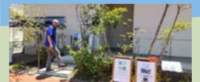
ハウスメーカー外部