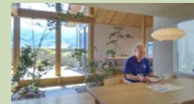
ハウスメーカー内部