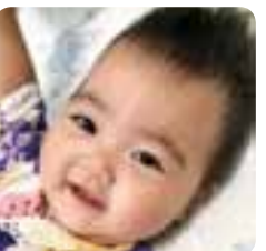
かいどう こと 改働 湖采ちゃん (北段原町)R1.9.27生 1歳