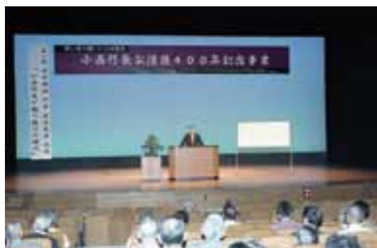
没後400年記念事業の記念講演会(平成12年)

大和市長の情熱からはじまった行長の顕彰事業は、今や地域おこしやまちづくりに生かされ、全国的にもユニークな取り組みとして高い評価を受けています。行長が宇土を治めた期間はわずか12年間、しかも多忙を極めた行長はあまり宇土にいなかったと言われていますので、現在の顕彰事業を行長が知ったら「そんなことまでしてもらって…」と少し複雑な心境になるかもしれません。