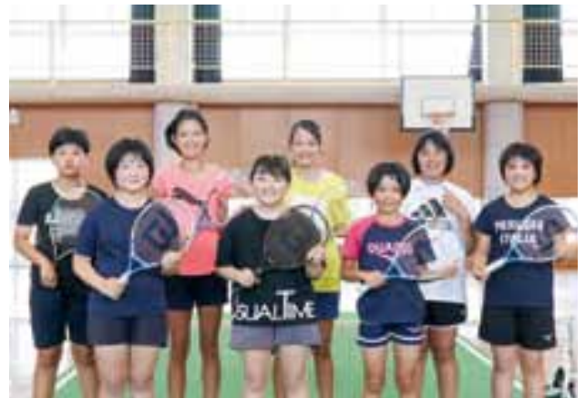
網津あじさい放課後クラブのみなさん