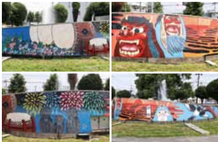
宇土の四季や名所をモチーフとした壁画