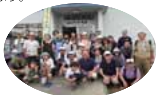
令和元年度収穫祭参加者の皆さん

走瀧マルメロ会では、毎年9月に収穫祭を実施しており、 本年度は9月6日(日)に実施する予定でしたが、新型コロナウ イルス感染症拡大防止のため中止せざるを得なくなりました。 今年の収穫祭では、新商品「時献上」の出来を味わって いただきたいと思っておりましたが残念です。楽しみにされ ていた皆様にはご迷惑をおかけしますが、ご理解をお願いし ます。