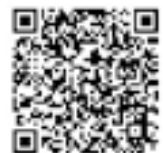
宇土市内設置 公共ライブカメラマップ

市内の河川の状況を市ホームページの河川カメラから閲覧できます。大雨時の近隣河川水位の確認や自主的避難の判断の目安としてご利用ください。