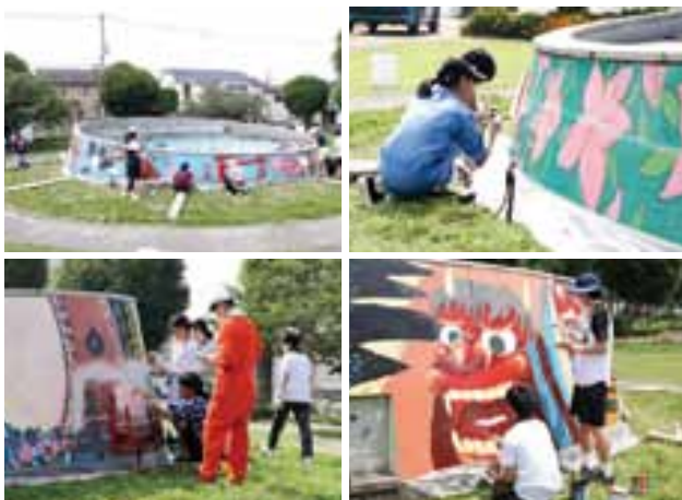
壁画を修復する美術部のみなさん

8月3日(月)、宇土中学校と宇土高校美術部の生徒33人が、熊本地震で傷んだ中央公園噴水の壁画を修復しました。噴水は、宇土ライオンズクラブが平成6年に設置、平成26年に当時の宇土中学校と宇土高校美術部が宇土の四季や名所をモチーフとした壁画を描きましたが、平成28年の熊本地震で被災したため、市が噴水の修復工事を行いました。美術部の生徒たちは、7月18日(土)と今回の2回に分けて、壁画をペンキで塗り上げました。