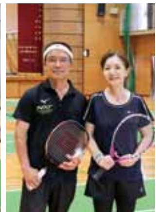
鶴城クラブ(写真左)とさざんかクラブ(写真右)のみなさん