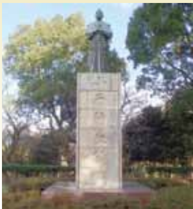
昭和55年に完成した小西行長銅像