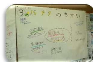
バナナ（最後までやりとげる）