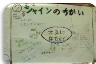
シャイン（元気にはたらく）