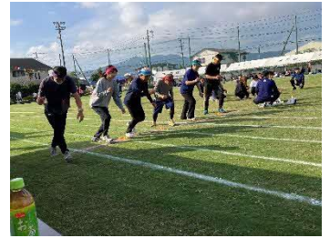
一般種目「おたまりレー」 スタート場面

早朝から、少々肌寒さが感じられるこの良き日、走潟小学校150周年記念秋季大運動会が、盛大に実施されました。子供たちの元気で大きな歌声から競技がスタートしました。子供たちの種目が14種目、大人が6種目、大人と子供一緒に2種目、来年児走が1種目の23種目でした。また、昼食前に、地域みんなで「走150」の人文字を作り、ドローンでの記念撮影がありました。競技は、赤組優勝、東地区の優勝・南下地区の準優勝で幕を閉じました。大会のテーマ「150年分の感謝と笑顔を全力で伝える運動会」のもと、記念大会にふさわしい心に残る運動会となりました。