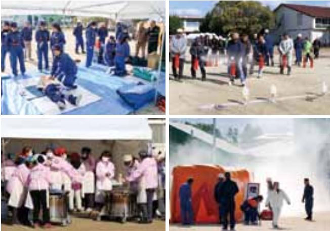
総合防災訓練のようす

市内全域で安否確認訓練を行った後、花園小グラウンドで宇土市総合防災訓練を実施しました。昨年は熊本地震で中止したため、2年ぶりの開催でしたが、市消防団や婦人会、自主防災組織など14団体から約250人が参加。訓練では、消火器の使い方や自動体外式除細動器(AED)を使った救命措置などを体験。その他、ボランティアセンター設置訓練や消防署・消防団合同の救出救助訓練などが行われ、昼には婦人会が炊き出し訓練で調理した保存食のアルファ米や手作りの豚汁が振る舞われました。