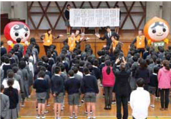
「人権の花」運動終了式の様子

「人権の花」運動終了式が宇土東小で行われ、全校児童316人が参加しました。同運動は、子どもたちが協力しながら花を育てることを通して、命の大切さや思いやり、相手の立場を考えることなどの人権思想を育むことを目的に実施。式では、学校に感謝状と記念品が贈呈されたほか、児童の作文発表などが行われました。児童が大切に育て採取したマリーゴールド、センニチコウなどの種は「ハートフルフェスタ」の来場者や次回の開催校へ配布するなどして、人権の輪を広げていくこととしています。