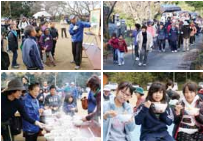
オリエンテーリングのようす

松山町の五色山で第4回オリエンテーリングが開催され、多くの参加者で賑わいました。これは里山再生に向けて間伐や散策路整備に取り組む「五色山ふれあい会」が花園公民館や上松山子ども会などの協力を得て毎年開催。参加者は宇城市の岡岳公園まで尾根伝いに歩く往復約4kmのコースをクヌギやカシなど広葉樹の森を落ち葉を踏みしめて1～2時間程歩きました。ゴールの五色山グラウンドではクリスマスのリースづくりなどを楽しみ、伍四季花クラブのだご汁やおにぎりを味わいました。