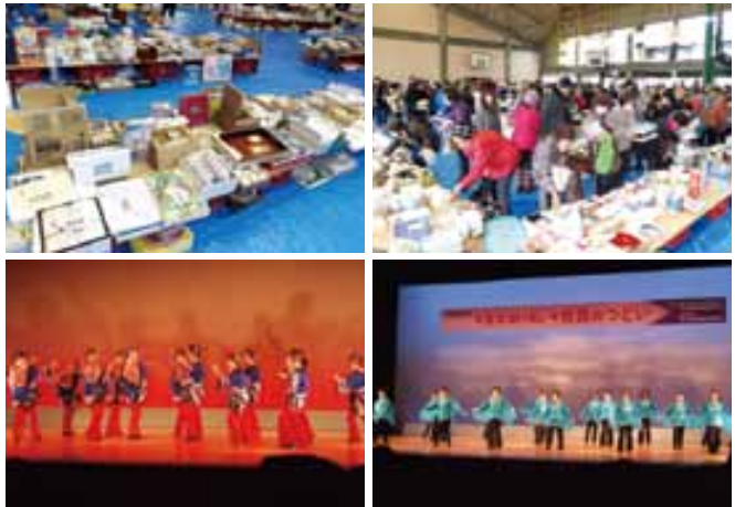
(写真上) チャリティーバザー (写真下) 芸能大会

福祉支援を必要とする人たちが安心して暮らせる地域づくりを目的に第39回歳末助けあい「市民のつどい」が開催されました。鶴城中で行われたチャリティーバザーでは善意で集まった品物を販売。多くの来場者でにぎわいました。また、市民会館で行われた芸能大会ではダンスやカラオケ、舞踊など約40の種目が披露され、来場者を楽しませました。バザーや芸能大会出演者からの浄財、来場者の募金で集まった100万円余りの益金は、市内に住む要援護世帯や地区社会福祉協議会に配分されます。