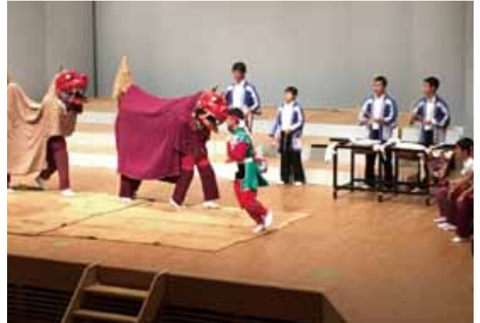
オープニングで披露された宇土御獅子舞

ウイングまつばせで宇城地区中学校音楽会が開催され、オープニングで鶴城中生徒による「宇土御獅子舞」が披露されました。生徒11人は、学校の文化祭で披露するため9月から約2カ月間、獅子や玉鈎、太鼓、ドラを稽古。10月の文化祭で見事な舞い方を披露しました。その評判が良かったため、音楽会への出演が決まりました。宇土御獅子舞は、県の重要無形民俗文化財に指定されており、後継者不足が進むなか、将来の伝統文化の担い手として今後の活躍が期待されます。