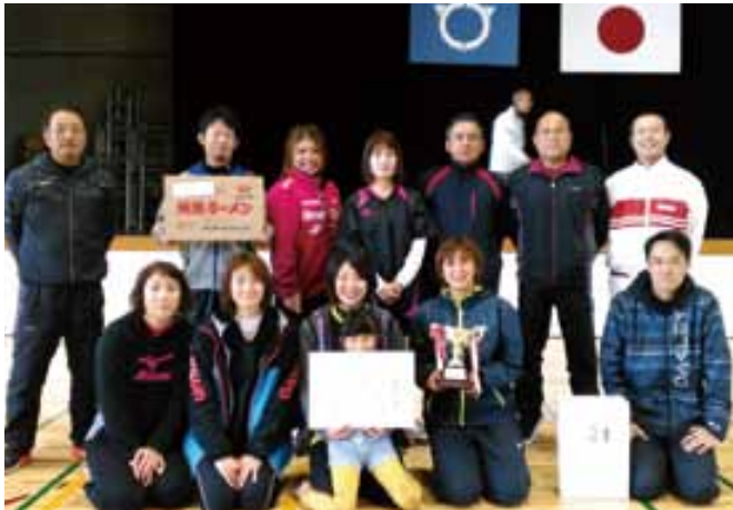
優勝した轟地区のみなさん