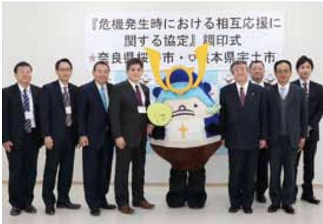
市役所仮設庁舎での調印式の様子