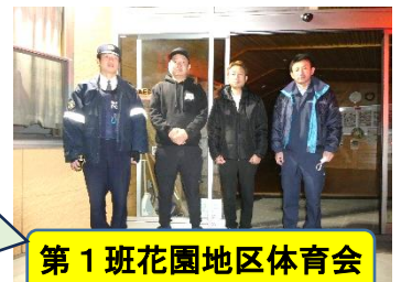
第1班花園地区体育会

花園青少協では、花園駐在所と連携して冬休み期間中にパトロールを行いました。第1班( 花園地区体育会 )は12月25日(木)に、第2班( 花園小PTA )は1月7日(水)に実施し、 青少年健全育成の啓発 に努めることができました。