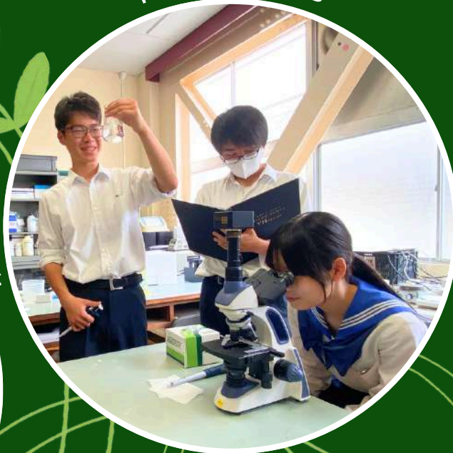
竹炭で赤潮に挑む