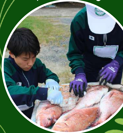
命をいただく学び