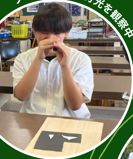
プリズムによる分光を観察中