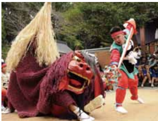
西岡神宮境内で奉納される獅子舞(御神事舞方)