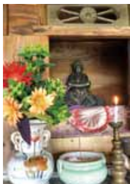
住民から慕われている阿弥陀様