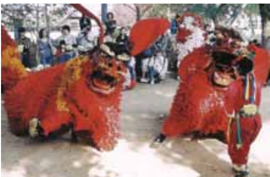
八代妙見祭の獅子舞