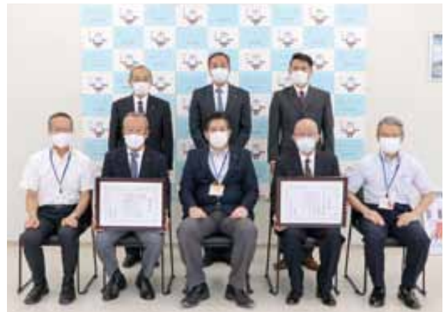
2社に表彰状が授与されました

地震後の被害調査の結果、簡易な修繕では元に戻らないことが判明したことから、一度解体して再構築することになり、平成30年春に解体工事を行い、令和元年11月から復元工事に着手して、令和2年3月に完成しました。眼鏡橋の解体復元は、全国的に事例が大変少ないうえに、極めて難易度が高い工程の連続でしたが、両企業の卓越した技術や知識による施工の結果、見事に元の姿へよみがえりました。