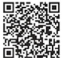
熊本県里親制度のページ