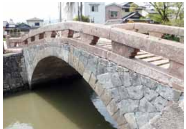
工事完了後の船場橋