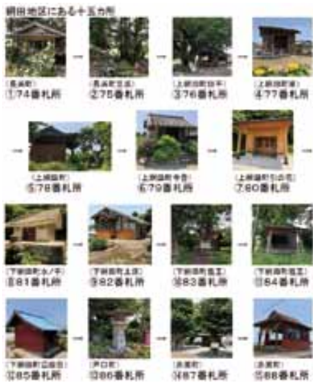
網田地区十五カ所一覧