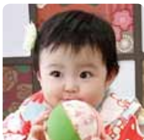
なかむら なほ 中村 凧乃花ちゃん

(高柳町)H30.10.27生 2歳 2歳おめでと♡毎日笑顔と癒しをありがとう♪