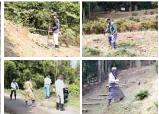
月に一度の清掃を行い、周辺を整備しています