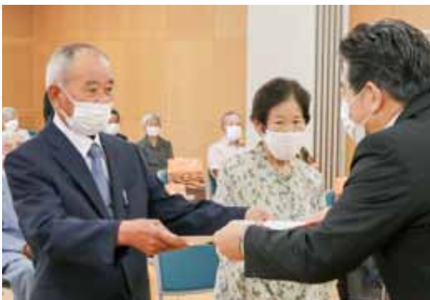
元松市長より表彰状を受け取る金婚夫婦

8月26日(水)、市内の4小学校で馬肉を材料とした給食が提供されました。材料の馬肉は、有限会社桜屋が「新型コロナウイルスの影響で生活が大きく変わってしまった子どもたちに元気を出してほしい」と6月に100kg寄贈したものです。寄贈された馬肉は、市給食センターでしぐれ煮に調理され、「コロナに負けんばい馬力丼」と名付けられて各校に提供されました。この日に提供された4校中の宇土小学校では、児童がおいしそうに「馬力丼」を食べていました。残る6小中学校には28日(金)に提供されました。