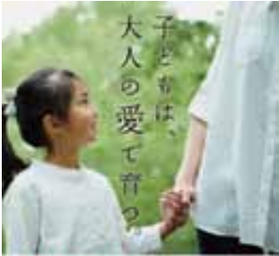
「里親」は、特別な存在ではありません。

県内には約800人の子どもたちが、さまざまな理由で親の元を離れて生活しています。このような子どもたちの養育をお願いするのが「里親制度」です。特別な資格や子育ての経験は問いません。数日からでも可能です。大切なのは、子どもに寄り添う気持ちと豊かな愛情です。詳しくはお問い合わせください。