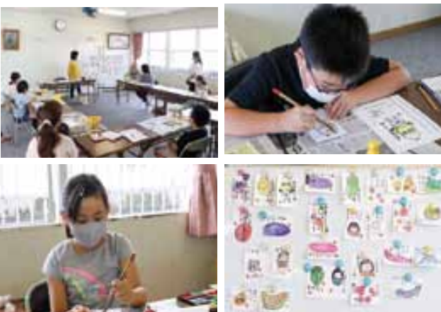
みんな思い思いの絵を描きました