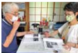
地元の人達のご協力