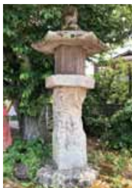
六面に彫られた六地藏

今回の記事が皆さんの郷土の歴史を知る一助になればと思います。興味がある人は、ぜひお住まいの地域の札所を巡ってみてはいかがでしょうか。