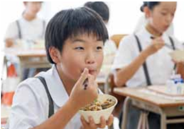
「馬力丼」をおいしそうに頬張る宇土小学校の児童