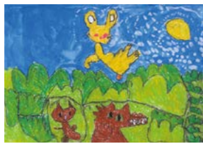
はなぞの保育園 やまもと ことは (年長) 「おばけのやだもん」を読んで