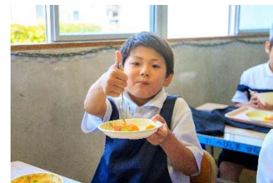
パイナップルをおいそうに食べる児童 (宇土東小)

今年、一口大にカットして、みかんや黄桃、ゼリー、白玉もちと合わせて「フルーツ白玉」として提供しました。甘いパイナップルに子どもたちも大変喜んでいました。今回の給食提供に關わってくださった多くの方々に感謝したいですね。