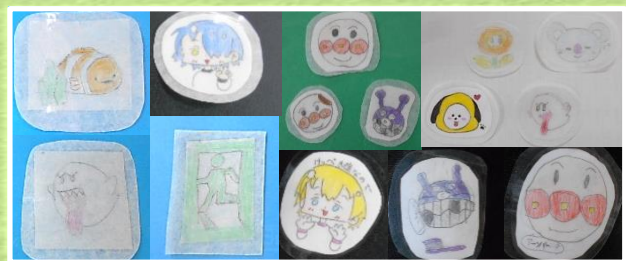
オリジナルシール作り