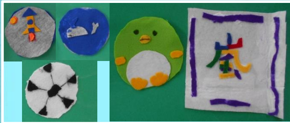
フェルトで小物作り