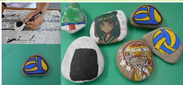
ペーパーウェイト作り