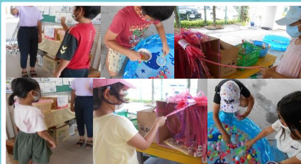
お楽しみイベントの様子