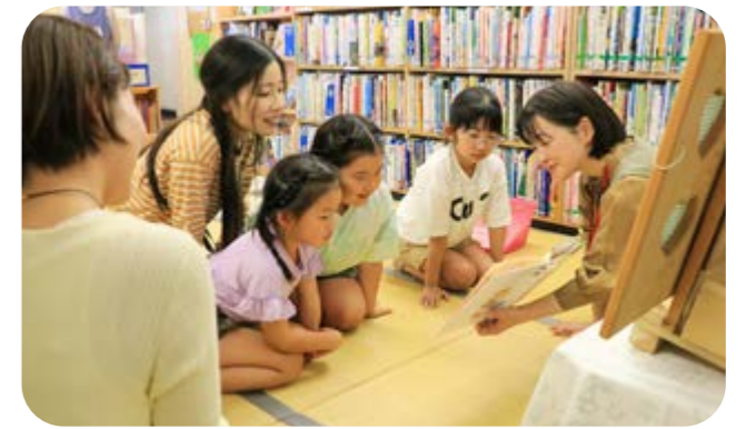
読み聞かせを楽しむ参加親子