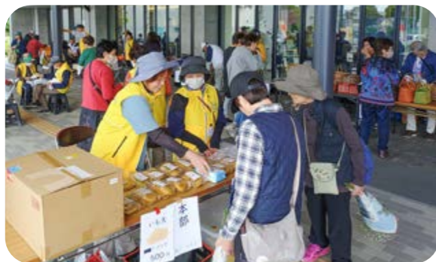
マルシェには多くの人々が来場しました