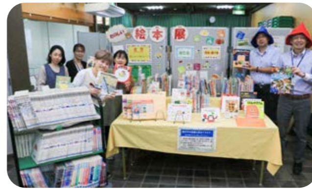
絵本展をPRする図書館職員の皆さん