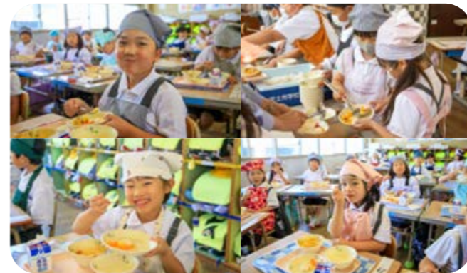
台湾産パイナップルを頬張る児童