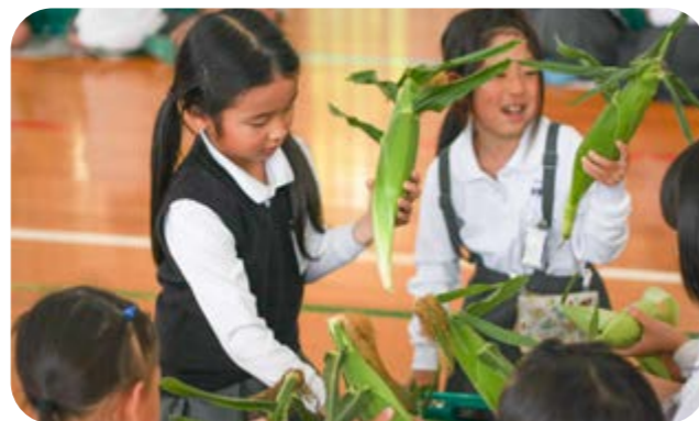
とうもろこしの皮むきを体験する宇土小の児童