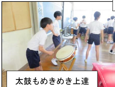
太鼓もめきめき上達