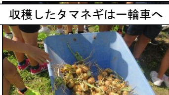
収穫したタマネギは一輪車へ