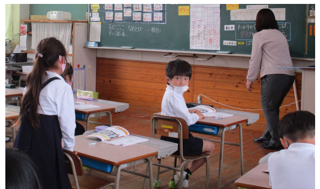
まとめの言葉を発表中