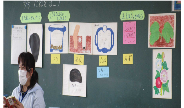
朝顔の種の植え方を学びます