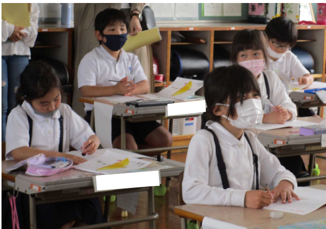
黒板の内容を自分のノートにまとめます