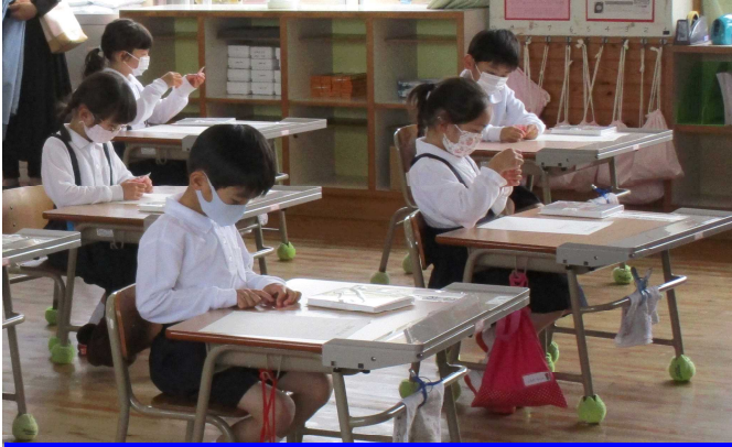
朝顔の種を観察中